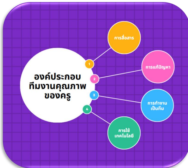
ภาพที่ 1 องค์ประกอบที่มงานคุณภาพของครู