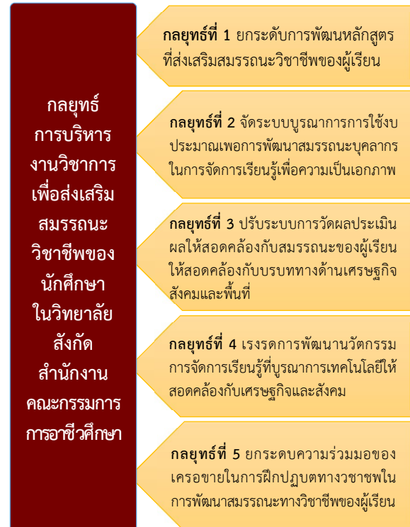
ภาพที่ 2 ภาพกลยุทธ์การบริหารงานวิชาการเพื่อส่งเสริมสมรรถนะวิชาชีพของนักศึกษาในวิทยาลัย สังกัดสำนักงานคณะกรรมการการอาชีวศึกษา

3. กลยุทธ์การบริหารงานวิชาการเพื่อส่งเสริมสมรรถนะวิชาชีพของนักศึกษาในวิทยาลัยสังกัดสำนักงานคณะกรรมการการอาชีวศึกษา ประกอบด้วย 5 กลยุทธ์หลัก 12 กลยุทธ์รอง ดังภาพที่ 2