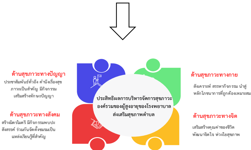
แผนภาพที่ 1 องค์ความรู้ที่ได้จากการวิจัย

สามารถอธิบายได้ว่า การพัฒนาประสิทธิผลการบริหารจัดการสุขภาวะองค์รวมผู้สูงอายุของโรงพยาบาลส่งเสริมสุขภาพตำบลในจังหวัดเพชรบูรณ์ มีกระบวนการดังต่อไปนี้