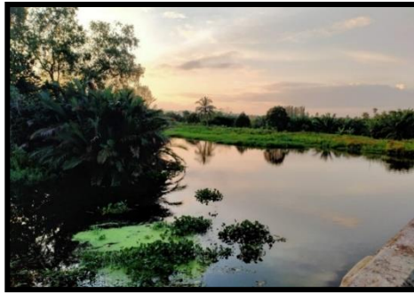
ภาพที่ 1 คลองท่ากูบ

6.2 คลองมะขามเตี้ย คลองมะขามเตี้ยเป็นคลองต้นน้ำมาจากบึงขุนทะเล ไหลมารวมกับแม่น้ำตาปีทางฝั่งขวา หนีอิทธิพลน้ำขึ้นน้ำลงในบึงขุนทะเล เป็นคลองหลักที่ใช้ในการเดินทาง ดังภาพที่ 2