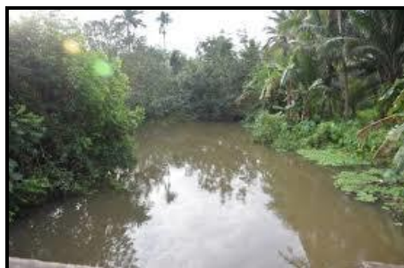
ภาพที่ 3 คลองดอนเกลี้ยง

6.3 คลองดอนเกลี้ยง คลองดอนเกลี้ยง เป็นสาขาที่อยู่บึงขุนทะเล เป็นคลองหลักที่ ประชาชนหมู่ที่ 1 ตำบลขุนทะเล และหมู่ที่ 3 ตำบลมะขามเตี้ย ใช้กันมากและใช้เดินทาง ดังภาพที่ 3