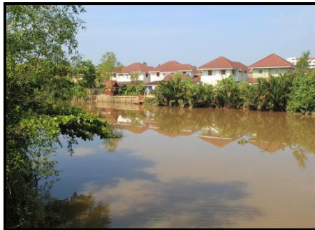
ภาพที่ 2 คลองมะขามเตี้ย

6.2 คลองมะขามเตี้ย คลองมะขามเตี้ยเป็นคลองต้นน้ำมาจากบึงขุนทะเล ไหลมารวมกับแม่น้ำตาปีทางฝั่งขวา หนีอิทธิพลน้ำขึ้นน้ำลงในบึงขุนทะเล เป็นคลองหลักที่ใช้ในการเดินทาง ดังภาพที่ 2