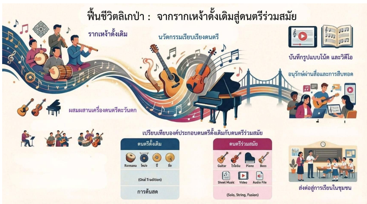
ภาพที่ 5 แผนผังแนวคิดและผลผลิตภายใต้ภาพ “ลิเกป่าสู่เมือง”