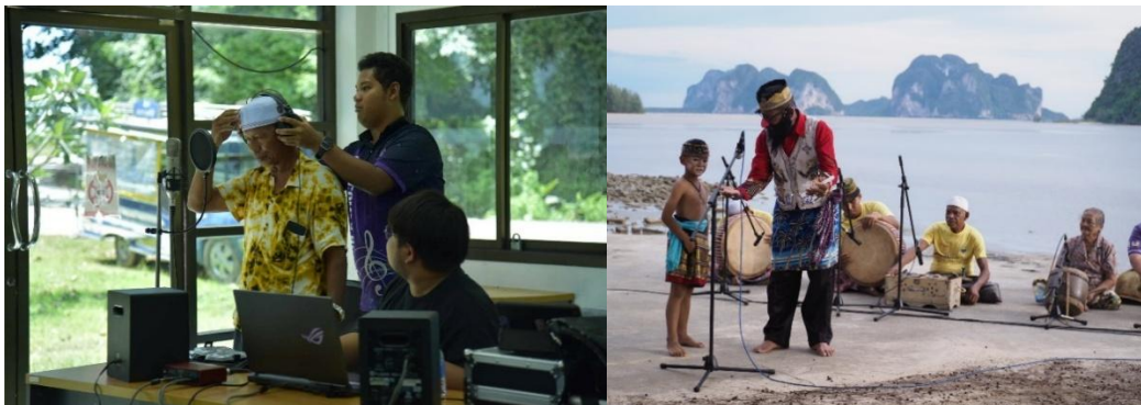
ภาพที่ 4 การบันทึกเสียงดนตรีลิเกป่าจัดเก็บในรูปแบบไฟล์เสียงเพลงสำหรับการเรียนรู้

การบันทึกเสียงดนตรีลิเกป่า ผลการศึกษาตามวัตถุประสงค์ข้อที่สอง โดยบันทึกดนตรีลิเกป่าในรูปแบบโน้ตเพลง และสื่อวีดิทัศน์สำหรับถ่ายทอดการเรียนรู้ ผลการศึกษาพบว่า การบันทึกเสียงดนตรีลิเกป่าทำได้ 2 รูปแบบ คือ ในรูปแบบ ไฟล์เสียงและรูปแบบของการบันทึกโน้ตเพลง ซึ่งทั้ง 2 ประเภทสามารถนำไปเป็น สื่อวีดิทัศน์เป็นแนวทาง ที่ช่วยเสริมประสิทธิภาพในการถ่ายทอดองค์ความรู้ดนตรีพื้นบ้านได้อย่างรอบด้าน โดยการบันทึกในรูปแบบโน้ตเพลง ทำให้สามารถจัดเก็บโครงสร้างทำนอง จังหวะ และรูปแบบการบรรเลงลิเกป่าได้อย่างเป็นระบบ ช่วยสร้างมาตรฐาน ในการเรียนรู้สำหรับผู้ที่ต้องการศึกษาดนตรีพื้นบ้านอย่างจริงจัง ผู้เรียนที่ได้ทดลองใช้โน้ตเพลงต่างระบุว่าเอกสาร ดนตรีที่เป็นลายลักษณ์อักษรทำให้เข้าใจรูปแบบทำนองหลักและจังหวะเฉพาะของลิเกป่าได้ง่ายขึ้น และช่วยให้ สามารถฝึกซ้อมได้ด้วยตนเองแม้จะไม่มีครูผู้สอนกำกับอย่างใกล้ชิด ในขณะเดียวกัน สื่อวีดิทัศน์ที่จัดทำขึ้นยังมี บทบาทสำคัญในการถ่ายทอดองค์ความรู้ด้านการปฏิบัติจริงของดนตรีลิเกป่าอย่างครบถ้วน วีดิทัศน์ช่วยให้ผู้เรียน มองเห็นทักษะการเล่นของนักดนตรี เช่น การตีจังหวะของรำมะนา การประสานจังหวะกับฉิ่งและฉาบ การเอื้อนเสียง เครื่องหมายหยุด หรือวิธีการสื่อสารระหว่างนักแสดงบนเวที ซึ่งเป็นลักษณะเฉพาะที่ไม่สามารถถ่ายทอดได้ครบถ้วน ผ่านโน้ตเพลงเพียงอย่างเดียว ผู้เรียนจึงสามารถเข้าใจทั้งด้านทฤษฎีและด้านปฏิบัติได้ควบคู่กัน ส่งผลให้เกิดการเรียนรู้ อย่างมีคุณภาพและเกิดแรงจูงใจในการศึกษาดนตรีพื้นบ้านมากขึ้น