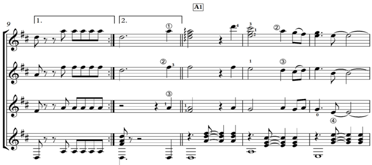
ภาพที่ 2 ตัวอย่างการเรียบเรียงทำนองเพลงต้นหยง

เพลงแขกแดงในการแสดงของคณะลิเกป่าสุนทรศิลป์ใช้ทำหน้าที่โหมโรงหรือเปิดการแสดง เริ่มต้นด้วยการแนะนำตัวละครในการแสดง บทบาทแขกแดงในการแสดงลิเกป่า การออกแขกแดงเป็นการแสดงตามธรรมเนียมดนตรีประกอบการแสดง ประกอบด้วย ท่อนนำที่มีทำนองชัดเจนของเพลงแขกแดง ผู้วิจัยเรียบเรียงแนวทำนองบนแขกแดงด้วยเครื่องดนตรีประเภทกีตาร์และเครื่องสายไวโอลิน โดยการใช้ลักษณะของสัดส่วนจังหวะที่อ้างอิงจากเสียงกลองรำมะนาในการแสดงดนตรีลิเกป่าให้มีจังหวะที่คล้ายกัน การเรียบเรียงทำนองในแนวเบสที่ไล่เสียงต่ำลงมาในตำแหน่งโน้ตตัว A F# และ E และสูงขึ้นไปถึงโน้ตตัว E ในห้องที่ 2 จากนั้นจึงไล่ระดับโน้ตขึ้น - ลงสลับกันจนครบ 4 ห้องในประโยคแรก ส่วนน้ำหนักของความดัง - เบาในช่วงอินโทร 2 - 3 ห้องแรกนั้น ผู้วิจัยใช้หลักการเพิ่มและลดน้ำหนักในการบรรเลงบรรเลง อ้างอิงจากเสียงของทำนองปีจากการแสดงดนตรีลิเกป่าของคณะการแสดงที่ผู้วิจัยได้ลงพื้นที่บันทึกเสียงเพื่อนำมาวิเคราะห์ให้มีจังหวะที่คล้ายกัน