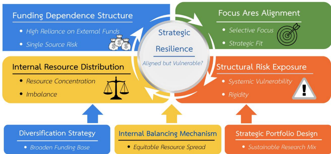
ภาพที่ 2 แบบจำลองพอร์ตลงทุนวิจัยเชิงยุทธศาสตร์พึ่งพาทรัพยากร (Strategic Resource-Dependent Research Portfolio Model: SRRPM)

Integrating Resource Dependence Theory & Strategic Research Management