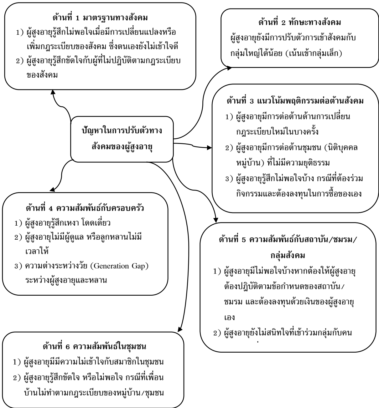
ภาพที่ 2 องค์ความรู้ใหม่