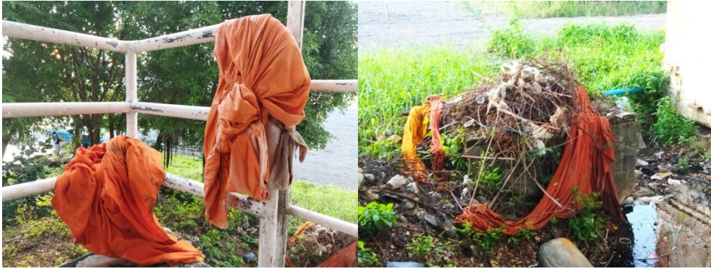
ภาพที่ 3 จีวรเก่าที่กลายเป็นขยะบุญ

พระพุทธเจ้าทรงเป็นผู้ที่ใช้ทรัพยากรที่มีอยู่อย่างจำกัดให้เกิดประโยชน์สูงสุดตามคำนิยามทางเศรษฐศาสตร์ โดยพระองค์ทรงอนุญาตให้ภิกษุใช้ผ้าถุงตามที่จะหามาได้ หรือเก็บเอาผ้าที่เขาทิ้งไว้ตามที่ต่าง ๆ บาง มีคนเขามาถวายบ้าง และบางทีก็เป็นผ้าห่อศพบ้าง (พระไตรปิฎกภาษาไทย 5/341/20-202) ซึ่งเรียกว่า “ผ้าบังสุกุล หรือ ผ้าคลุกฝุ่น” นั่นเอง ต่อมาพระอานนท์ได้ออกแบบจีวรให้เหมือนกับคันทนาของชาวมคธ ดังปรากฏข้อความที่พระพุทธเจ้าตรัสถามพระอานนท์ว่า “อานนท์ เธอเห็นนาของชาวมคธ ซึ่งเขาพูนดินขึ้นเป็นคันทนาสี่เหลี่ยม พูนคันทนายาวทั้งด้านยาวและด้านกว้าง พูนคันทนาคันในระหว่าง ๆ ด้วยคันทนาลิ้น ๆ พูนคันทนาเชื่อมกันทาง 4 แพร่งตามที่ซึ่งคันทนากับคันทนาผ่านตัดกันไปหรือไม่? ...เธอสามารถแต่งจีวรของภิกษุทั้งหลายให้มีรูปร่างนั้นได้หรือไม่?” ซึ่งพระอานนท์ตอบว่า “สามารถ พระพุทธเจ้าข้า” (พระไตรปิฎกภาษาไทย 5/345/213-214) จนถึงยุคปัจจุบันพระสงฆ์สายเถรวาทยังใช้รูปแบบจีวรที่พระอานนท์ ออกแบบไว้ ไม่ได้แก้ไขหรือเปลี่ยนแปลงรูปแบบอะไรเลย การสะท้อนให้เห็นว่าพระพุทธเจ้าทรงเป็นผู้ใช้ทรัพยากรที่มีอยู่ จำกัดให้เกิดประโยชน์สูงสุด ไม่เกิดเป็นต้นทุนจม (Sunk Cost) จากการใช้ผ้าจีวร นั่นก็คือ การใช้จีวรให้เกิดความคุ้มค่า มากที่สุด ดังมีปรากฏในเรื่องพระเจ้าอุเทนถวายจีวร (พระไตรปิฎกภาษาไทย 7/445/387-389)