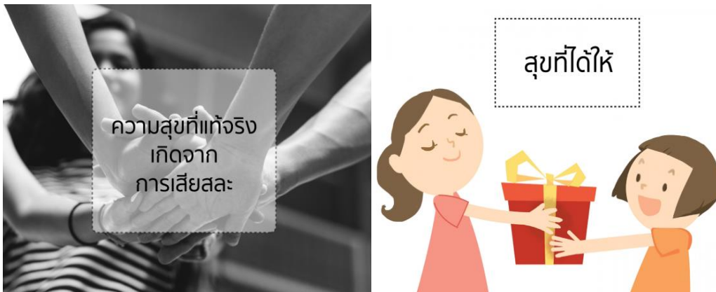
ภาพที่ 1 ความสุขเกิดจากการให้