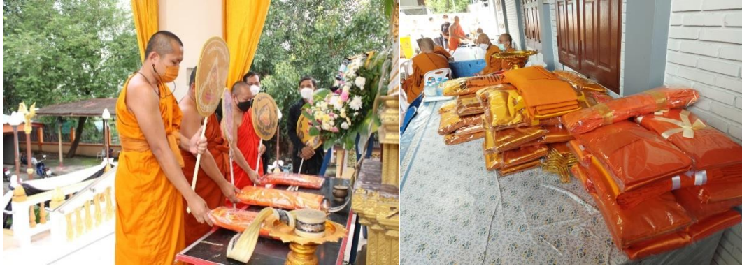
ภาพที่ 2 การถวายผ้าบังสุกุลจีวรกับความเชื่อหลังความตาย