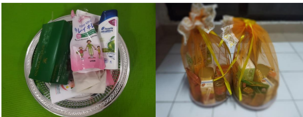
ภาพที่ 4 รูปแบบผลิตภัณฑ์สังฆทานสำเร็จรูป

จากเรื่องราวของพระเจ้าอุเทนถวายจีวรแก่พระสงฆ์ที่ปรากฏในพระไตรปิฎกนั้น แสดงให้เห็นว่าในสมัยพุทธกาล พระพุทธองค์ทรงเน้นให้สมณศากยบุตรใช้สิ่งของหรือบริวารให้เกิดประโยชน์สูงสุด ไม่บริโภคเพื่อสรวนงาม ไม่บริโภคเพื่อความสนุก ไม่บริโภคเพื่อผลิตเพลินสนุกสนาน ไม่บริโภคเพื่อเกิดกำลังพลังทางกาย แต่ให้เป็นไปเพื่อปกปิดร่างกายไม่ให้เกิดความอายและสามารถนำไปใช้ประโยชน์อย่างอื่นได้ด้วย การใช้ประโยชน์จากจีวรของสมณศากยบุตรสมัยพุทธกาลจึงสะท้อนให้เห็นการถนอม การรักษาค่าของสิ่งของ การแปรรูปผลิตภัณฑ์ให้เกิดมูลค่าเพิ่มเมื่อผลิตภัณฑ์นั้นด้อยค่าลง ดังนั้น ผ้าจีวรในสมัยพุทธกาลจึงเป็นของที่มีมูลค่า ใช้แล้วคุ้มค่า เกิดประโยชน์สูงสุด และไม่เกิดของเสียหรือของเหลือ