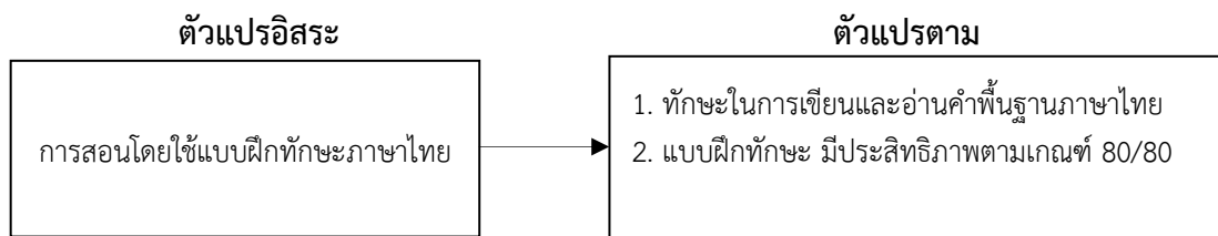
ภาพที่ 1 กรอบแนวคิดการวิจัย

ผู้วิจัยกำหนดกรอบแนวคิดในการวิจัยโดยใช้แนวคิดการเรียนรู้โดยการปฏิบัติ (Learning by doing) จัดกิจกรรมการเรียนรู้ในรูปแบบ Active Learning แบบ 5 ขั้นตอน (5 Steps) ตามแนวคิดของ Dewey (1986) เพื่อที่จะพัฒนาผู้เรียนโดยใช้โดยใช้แบบฝึกทักษะภาษาไทย ตามตัวแปร ดังนี้ ดังนี้