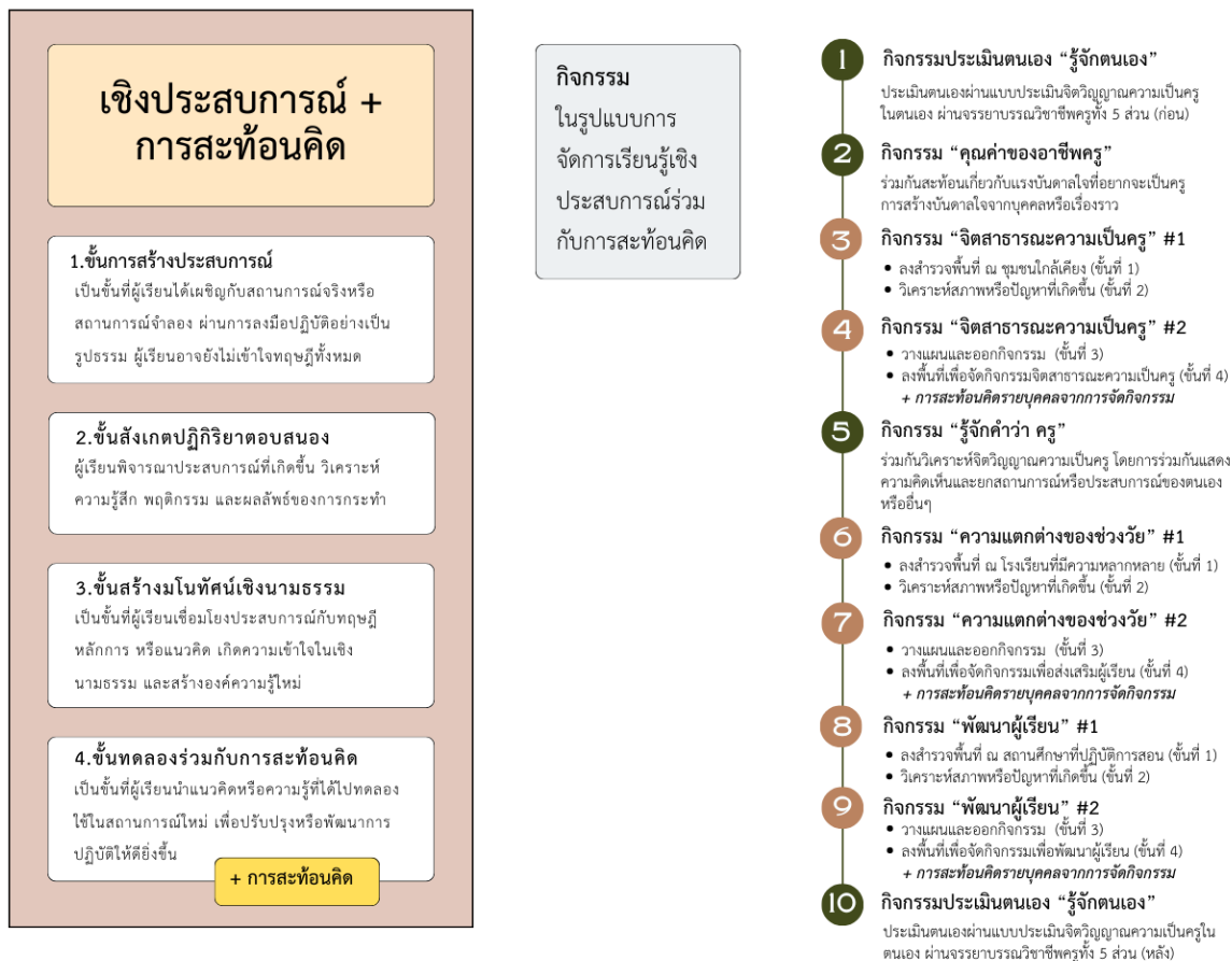
ภาพที่ 2 องค์ความรู้ใหม่