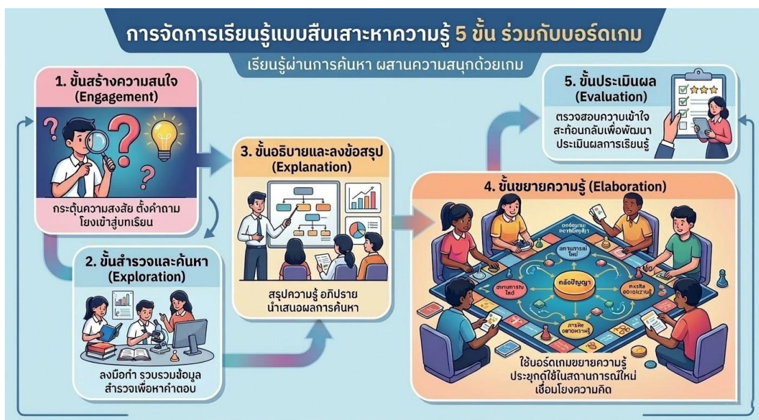
ภาพที่ 2 การจัดการเรียนรู้แบบสืบเสาะหาความรู้ 5 ขั้น ร่วมกับบอร์ดเกม

การจัดการเรียนรู้แบบสืบเสาะหาความรู้ 5 ขั้น ร่วมกับบอร์ดเกม เป็นการจัดการเรียนการสอนด้วยลำดับขั้นตอนของการสืบเสาะหาความรู้โดยใช้บอร์ดเกมเข้ามาเป็นตัวช่วยเสริมในการจัดการเรียนรู้ผ่านกระบวนการที่เป็นระบบ 5 ขั้นตอน ได้แก่ ขั้นที่ 1 สร้างความสนใจ ขั้นที่ 2 สำรวจและค้นหา ขั้นที่ 3 อธิบายและลงข้อสรุป ขั้นที่ 4 ขยายความรู้โดยใช้บอร์ดเกม และขั้นที่ 5 ประเมินผล เพื่อกระตุ้นความสนใจของนักเรียน ทำให้การจัดการเรียนการสอนมีความแปลกใหม่ เริ่มจากการสร้างความสนใจ สำรวจและค้นหา อธิบายและลงข้อสรุป ขยายความรู้โดยใช้บอร์ดเกม เพื่อให้ให้นักเรียนนำความรู้ที่ได้จากการสำรวจและสรุปไปเชื่อมโยงกับสถานการณ์หรือบริบท ใหม่ ๆ และประเมินผลจากการจัดการเรียนรู้ที่เป็นลำดับขั้นร่วมกับการใช้บอร์ดเกมเป็นสื่อการเรียนรู้ ช่วยสร้างบรรยากาศการเรียนรู้ที่ผ่อนคลายและสนุกสนาน ส่งผลให้นักเรียนเกิดความสนใจในการศึกษาเนื้อหา อีกทั้งยังเอื้อต่อการพัฒนาทักษะการคิดวิเคราะห์สถานการณ์ทางกฎหมายได้ด้วยตนเอง การตัดสินใจ การแลกเปลี่ยนความคิดเห็น และการแก้ปัญหาร่วมกับผู้อื่น จึงส่งผลให้ผลสัมฤทธิ์ทางการเรียนของนักเรียนสูงขึ้นได้