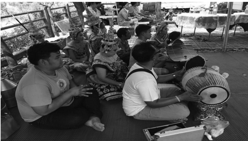
ภาพที่ 7 วงดนตรี