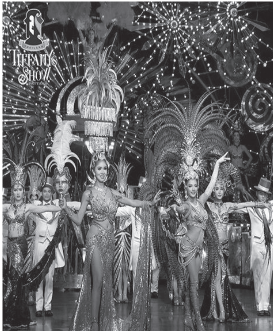
ภาพที่ 4 การแสดงของทิฟฟานีโชว์ พัทยา