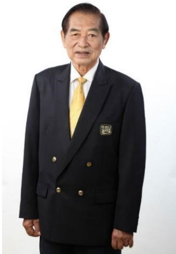
ภาพที่ 1 พลตรีประพาศ ศกุนตนาค