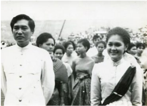
ภาพที่ 5 รัชบทเป็นคุณเปรม ในละครสี่แผ่นดิน ภาพที่ 6 อัดเทปเสียงการขับเสภาละครจักร ๆ วงศ์ ๆ