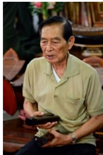
ภาพที่ 2 พลตรีประพาศ ศกุนตนาคขับเสภา