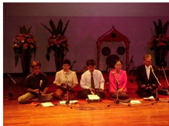
ภาพที่ 8 คณาจารย์ผู้ขับเสภางานเสภาเสนาะ คำหวาน