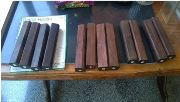
ภาพที่ 9 กรับเสภาของพลตรีประพาศ ศกุนตนา

ด้านการขับเสภาและตีกรับเสภา พลตรีประพาศ ศกุนตนา จะถ่ายทอดการขับเสภาและการตีกรับขั้นพื้นฐานให้แก่ผู้เรียน เช่น การฝึกไม้กรับเสภาเบื้องต้น และการฝึกบทขับเสภาเรื่องขุนช้างขุนแผน ตอน ขุนแผนขึ้นเรือนขุนช้างถึงพาวันทองหนีไปอยู่ป่า ฉากขุนแผนพินม่าน เป็นต้น อีกทั้งพลตรีประพาศ ศกุนตนา ยังได้ถ่ายทอดกรรมวิธีการสร้างกรับเสภาให้กับลูกศิษย์ เช่น ถ่ายทอดให้กับนายณัฐวุธ นุราช ข้าราชการครูโรงเรียนร่มเกล้าวัฒนานคร สระแก้ว รัชมิ่งคลาภิเชก