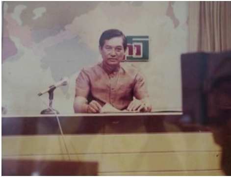
ภาพที่ 3 ทำหน้าที่ผู้ประกาศข่าว ช่อง ททบ.5