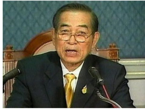
ภาพที่ 4 ปฏิบัติหน้าที่โฆษกคณะปฏิวัติ