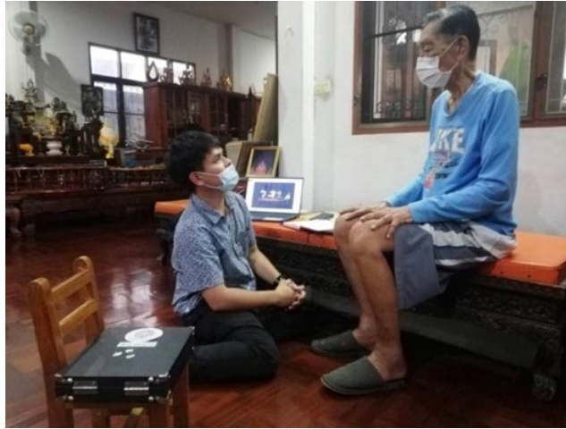
ภาพที่ 13 ผู้วิจัยสัมภาษณ์พลตรีประพาศ ศกุนตนา