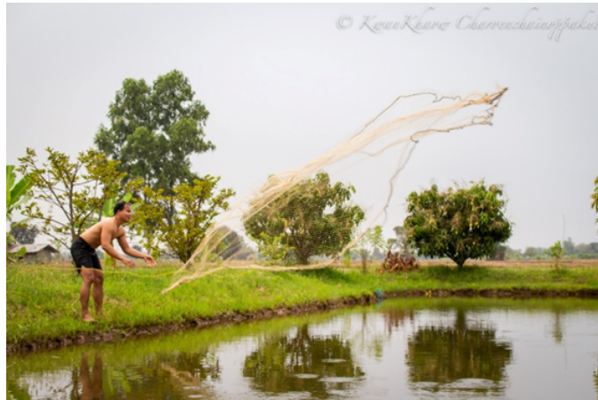
ภาพประกอบที่ 3 ภาพถ่ายอัตลักษณ์ของชาติพันธุ์ลาวเวียงด้านอาชีพ

เทคนิคที่แนะนำ ได้แก่ การตั้ง ISO ต่ำเพื่อภาพคมชัด การใช้รูรับแสงกว้างเมื่อเน้นรายละเอียดเฉพาะ หรือแคบขึ้นเมื่อเน้นภาพรวม ความเร็วชัตเตอร์ควรอยู่ที่ 1/125 วินาทีขึ้นไป และการจัดองค์ประกอบด้วยมุมใกล้และมุมกว้างสลับกันจะช่วยสร้างความหลากหลายทางภาพลักษณ์อย่างมีชีวิตชีวา