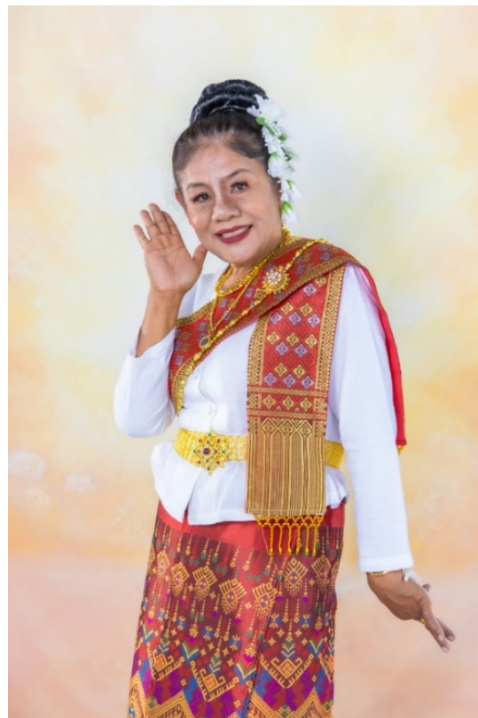
ภาพประกอบที่ 2 ตัวอย่างภาพถ่ายอัตลักษณ์ของชาติพันธุ์ลาวเวียงด้านการแต่งกาย

การจัดแสงแบบ key light, และ fill light รวมถึงการตั้งค่ากล้อง เช่น ISO ต่ำ รูรับแสง f/5.6 – f/8 และความเร็วชัตเตอร์ที่เหมาะสม จะช่วยให้ภาพมีมิติและเก็บรายละเอียดของเครื่องแต่งกายได้ชัดเจน