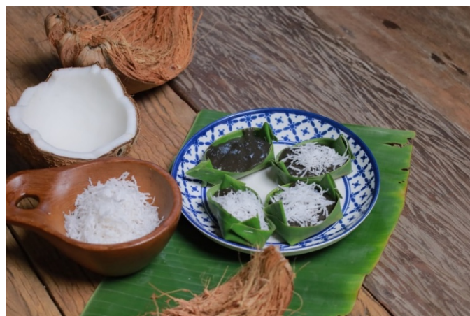
ภาพประกอบที่ 4 อัตลักษณ์ของชาติพันธุ์ลาวเวียงด้านอาหาร

การใช้แสงธรรมชาติหรือแสงจากด้านข้าง (side lighting) จะช่วยขับเน้นพื้นผิวและสีของอาหารได้ดีขึ้น โดยเฉพาะในช่วง golden hour (เช้าและเย็น) การเลือกเลนส์ฟิกซ์ เช่น 35mm หรือ 50mm จะให้ภาพที่คมชัดและละลายฉากหลังได้ดี การถ่ายภาพมุมสูงเหมาะกับอาหารที่จัดบนโต๊ะ ส่วนมุมเฉียงหรือ eye level เหมาะกับการเก็บรายละเอียดวัตถุดิบหรือขั้นตอนการทำ การวางจานอาหารตามกฎสามส่วนและการเสริมฉากหลังด้วยของพื้นถิ่น เช่น ตะกร้าหวายหรือผ้าทอลายพื้นเมือง จะช่วยให้ภาพมีบริบทวัฒนธรรมที่ชัดเจนยิ่งขึ้น