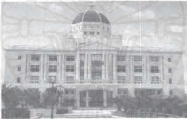
รูปที่ ๔ อาคารศูนย์ข้อมูลสารสนเทศ เป็นอาคารที่ช่วยส่งเสริมการเรียนการสอนที่สำคัญและทันสมัย

อาคารที่ใช้ส่งเสริมการเรียนการสอนอีก ๒ อาคาร อาคารหนึ่งคืออาคารที่ใช้ทำกิจกรรมต่างๆ ของนักศึกษา ซึ่งมีห้องสำคัญๆ คือห้องพยาบาล ห้องออกกำลังกาย และร้านสะดวกซื้อ อยู่ในตัวอาคาร อีกอาคารหนึ่งคือ โรงอาหาร เป็นอาคาร ๓ ชั้น ขายอาหารหลากหลาย ที่บริเวณชั้น ๓ ยังมีส่วนที่เป็นห้องจัดเลี้ยงและขายอาหาร