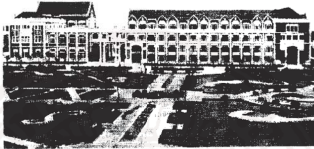
รูปที่ ๖ การจัดสวนสวยงามในมหาวิทยาลัยนานาชาติศึกษาแห่งนครเชียงใหม่ วิทยาเขตขงเจียง

การเรียนการสอนตามหลักสูตรของมหาวิทยาลัยนั้นๆ ต่อไป และที่มหาวิทยาลัยนานาชาติศึกษาแห่งนครเชียงใหม่ วิทยาเขตขงเจียง ก็ดำเนินการต่างๆ เช่นที่กล่าวมาข้างต้น