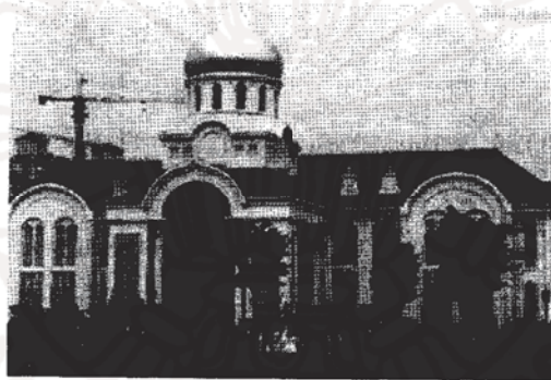
รูปที่ ๓ อาคารหมายเลข ๖ หรืออาคารสถาปัตยกรรมรัสเซียเป็นตัวอย่างหนึ่งของอาคารที่มีศิลปะการก่อสร้างที่แสดงเอกลักษณ์ของประเทศเจ้าของภาษา

คืออาคารนี้มีส่วนของห้องสมุด เพื่อให้ นักศึกษามีโอกาสค้นคว้า และพัฒนาความรู้ต่างๆ แยกเป็นห้องเป็นชั้น ได้แก่ ห้องภาษาจีน ห้องภาษาอังกฤษ ห้องภาษาต่างประเทศอื่นๆ ห้องวารสาร - นิตยสาร โดยแบ่งเป็นความรู้หลายด้าน ทั้งปรัชญา ศาสนา วรรณกรรม ประวัติศาสตร์ วิทยาศาสตร์ ในห้องภาษาอังกฤษยังอำนวยความสะดวกให้นักศึกษาสามารถอ่านภาษาอังกฤษให้เข้าใจง่ายขึ้นด้วยการแปลสรุปจากภาษาอังกฤษเป็นภาษาจีนบางส่วน และคงเนื้อหาสำคัญบางส่วนไว้ ห้องสมุดนี้ ยังมีบริการยืม-คืนหนังสือได้ที่ชั้น ๓ และให้เฉพาะนักศึกษาค้นคว้า ห้ามขอยืมที่ชั้น ๑ และชั้น ๔ ในบริเวณอาคารยังมีส่วนของห้องประชุมอยู่ทั้งฝั่งตะวันตก และตะวันออก