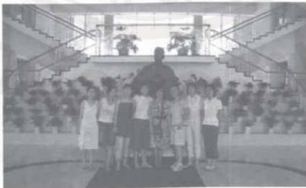
รูปที่ ๕ ผู้เขียนถ่ายรูปร่วมกับนักศึกษาหน้ารูปปั้นหลูซิ่น ภายในอาคารศูนย์ข้อมูลสารสนเทศ