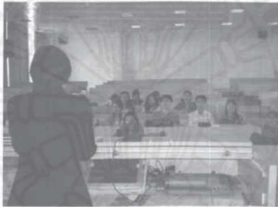
รูปที่ ๗ บรรยากาศการเรียนการสอนนักศึกษาวิชาเอกภาษาไทยชั้นปีที่ ๓ ของสถาบันภาษาตะวันออก มหาวิทยาลัยนานาชาติศึกษาแห่งนครเชียงใหม่ วิทยาเขตขงเจียง

ในด้านสถานที่เรียนนี้ แตกต่างจากมหาวิทยาลัยธรรมศาสตร์ ศูนย์รังสิตโดยสิ้นเชิง เพราะแม้ว่าที่ศูนย์รังสิตจะมีคณะต่างๆ โดยเฉพาะแล้ว หากแต่ละคณะไม่มีห้องเรียนประจำ หรือมีก็เป็นจำนวนน้อย นักศึกษาของแต่ละคณะต้องเรียนที่อาคารบรรยายรวมทั้งวิชาเอก วิชาบังคับ และวิชาเลือก นักศึกษาทุกคนต้องเดินเรียน ไม่มีห้องเรียนประจำ และครูก็ต้องเดินสอนเช่นกัน จึงอาจใช้เวลาบ้างกว่าจะพร้อมในการเรียนการสอน