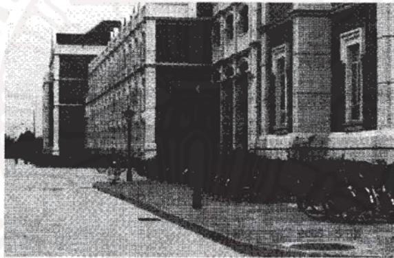
รูปที่ ๑ การเดินทางภายในวิทยาเขตขงเจียงนิยมใช้รถจักรยาน จึงเห็นรถจักรยานจำนวนมากจอดอย่างเป็นระเบียบที่บริเวณหน้าอาคารเรียนแต่ละอาคาร

การเดินทางที่กล่าวข้างต้นเป็นการเดินทางระหว่างมหาวิทยาลัยนานาชาติศึกษาแห่งนครเชียงใหม่ เขตหนึ่งกับวิทยาเขตขงเจียง ส่วนภายในวิทยาเขตขงเจียงนั้น นอกจากจะเห็นอาจารย์และนักศึกษาใช้วิธีเดินเมื่อจะไประหว่างอาคารต่างๆ ซึ่งนับเป็นการออกกำลังกายที่ดีแล้ว นักศึกษาจำนวนมากยังนิยมใช้รถจักรยานด้วย ดังนั้นบนถนนภายในบริเวณวิทยาเขตขงเจียงจึงได้เห็นนักศึกษาถีบรถจักรยานกันอยู่ทั่วไป และยังมีที่จอดรถจักรยานบริเวณหน้าอาคารแต่ละอาคาร ทำให้เป็นระเบียบดี ทั้งนี้ดูจะไม่แตกต่างนักเมื่อเทียบกับนักศึกษาในมหาวิทยาลัยธรรมศาสตร์ ศูนย์รังสิตที่นิยมใช้รถจักรยานเช่นกัน