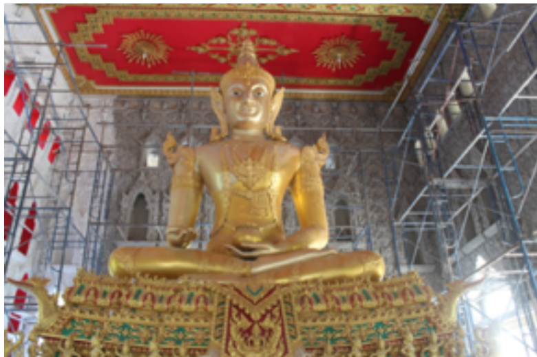
ภาพที่ 6: พระไภษัชยคุรุฯ พระพุทธเจ้าแพทย์ วัดพระบาทน้ำพุ

พุทธลักษณะของพระไภษัชยคุรุฯที่วัดนี้แสดงความเป็นพุทธศิลป์แบบไทยอย่างชัดเจน ทำเป็นพระพุทธรูปทรงเครื่อง สวมเครื่องประดับศิระคล้ายเครื่องทรง กษัตริย์มีมงกุฎ เฑริด กรรณเจียก รัตเกล้า พระวรกายมีเครื่องประดับ เช่นทับทรวง พาหุรัต ทองกร ประทับขัดสมาธิราบ พระหัตถ์ขวาแสดงมุทราประทานพร พระหัตถ์ซ้ายวางบนพระเพลาหงายฝ่าพระหัตถ์ บนฝ่าพระหัตถ์มีหม้อยาวางไว้