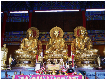
ภาพที่ 3: พระประธานในพระอุโบสถของวัดมังกรกมลาวาส

ส่วนวัดในความเชื่ออนันนิกาย ที่เป็นพุทธศาสนamahayanaจากประเทศญวนและได้เข้าสู่ประเทศไทยก่อนพุทธศาสนamahayanaที่มาจากประเทศจีน ส่วนใหญ่มักพบว่ามักนิยมสร้างพระศากยมุนีเป็นพระประธานเพียงองค์เดียว เช่นที่วัดคันเิงตือ (วัดอู่ยกยราชบารุง) วัดกว้างเพือกตือ (วัดอนันนิกายาราม) (การสร้างพระประธานเรียงกัน 3 องค์ ในวัดอนันนิกายมักเกิดขึ้นในช่วงสมัยรัชกาล ที่ 5 ที่พุทธศาสนาแบบจีนเข้ามามีบทบาทแล้ว) จะมีเพียงวัดกัมโล่วยี่ หรือ วัดทิพวารวิหาร ที่มีการสร้างพระประธานเรียงกัน 3 องค์ โดยพุทธลักษณะต่างๆ คล้ายคลึงกับพระประธานในวัดพุทธศาสนาแบบจีนนิกาย แต่การสร้างพระประธานเรียงกัน 3 องค์ดังกล่าวที่วัดทิพวารวิ จากการสัมภาษณ์นักวิชาการอิสระด้านพุทธศาสนamahayana นายเศรษฐพงษ์ จงสงวน ก็ไม่สามารถระบุได้ว่ามีมาตั้งแต่แรกสร้างวัด หรือเกิดขึ้นหลังจากการปรับเปลี่ยนให้วัดทิพวารวิหารนี้เป็นวัดในพุทธศาสนาแบบจีนนิกาย (สัมภาษณ์เมื่อวันที่ 7 กุมภาพันธ์ พ.ศ. 2559 วัดทิพวารวิหาร กรุงเทพฯ)