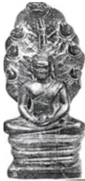
ภาพที่ 1: พระไภษัชยคุรุฯ ฉลองพระองค์แบบนักบวช ไม่สวมเครื่องประดับ

แบบที่ 1 องค์พระไภษัชยคุรุฯ ไม่สวมเครื่องประดับ ลักษณะทางประติมานวิทยาของกลุ่มนี้ทำเป็นรูปบุคคลมีลักษณะตามคัมภีร์มหาบุรุษลักษณะ 32 ประการเช่น พระกรรณยาว มีพระอุษณิษะ ขมวดพระเกศาเป็นก้นหอย พระอุณาโลมอยู่ตรงกลางระหว่างพระขนงทั้งสองข้าง ฉลองพระองค์แบบนักบวช จีวรบางเรียบไม่มีลวดลาย ประทับขัดสมาธิราบ พระหัตถ์ทั้งสองข้างวางประสานกันบนพระเพลาแสดงธยามุทรา บนฝ่าพระหัตถ์มีวัตถุคล้ายหม้อยาหรือผอบวางไว้ (ภาพที่ 1) ประติมานวิทยาของพระไภษัชยคุรุฯ ในแบบที่ 1 นี้ น่าจะเกิดจากแนวคิดที่เป็นพื้นฐานในการสร้างพระพุทธรูปทั่วไปแต่เดิมที่แต่งกายแบบนักบวช ไม่สวมเครื่องประดับ