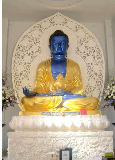
ภาพที่ 4: พระโกษชัยคุรุฯ แสดงพุทธศิลป์แบบไทย พระวรกายเป็นสีน้ำเงิน วัดทรงธรรมกัลยาณี จังหวัดนครปฐม

ศาสนาแบบเถรวาทและวัดในพุทธศาสนาเถรวาทแบบจีน โดยมีลักษณะทาง ประติมานวิทยาที่ต่างกันไปในแต่ละวัด ตามแนวคิดของผู้กำหนดให้สร้างมีการผสม ผสานกับความเชื่อท้องถิ่น แสดงพุทธศิลป์แบบไทยมากขึ้น แต่ก็ยังคงลักษณะที่ สำคัญทางประติมานวิทยาของพระโกษชัยคุรุฯ ไว้ คือในฝ่าพระหัตถ์ซ้ายจะมีหม้อ ยาววางไว้ เช่น วัดทรงธรรมกัลยาณี มีการสร้างพระโกษชัยคุรุฯ ราว พ.ศ. 2548 (ภาพที่ 4)