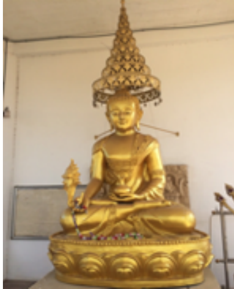
ภาพที่ 5: พระโภาชชยคุรุฯ แสดงพุทธศิลป์แบบไทย วัดป่าทุ่งกุลาเฉลิมราช จังหวัดร้อยเอ็ด

ที่มีพุทธลักษณะแบบทิเบตจำนวนมาก จึงน่าจะเป็นแรงบันดาลใจให้กับผู้ออกแบบมาใช้เป็นต้นแบบและเกิดการผสมผสานกับพุทธศิลป์แบบไทย ได้ลักษณะทางประติมานดังกล่าวออกมา) ส่วนพระหัตถ์ซ้ายวางบนพระ เพลาหงายฝ่าพระหัตถ์ ซีนบนฝ่าพระหัตถ์มีหม้อยาวงไว้ (ภาพที่ 5)