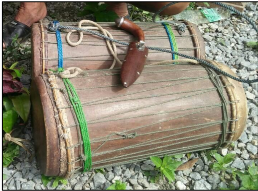
ภาพที่ 4 กลองทน