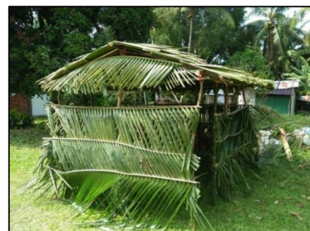
ภาพที่ 7 โรงกาหลอที่สร้างเสร็จสมบูรณ์