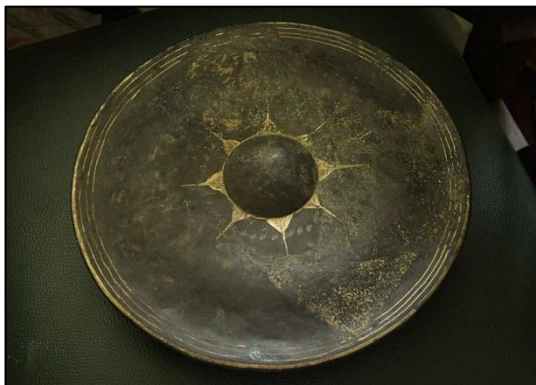
รูปที่ 5 ฆ้อง