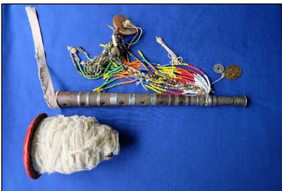
ภาพที่ 3 ปี่กาหลอ