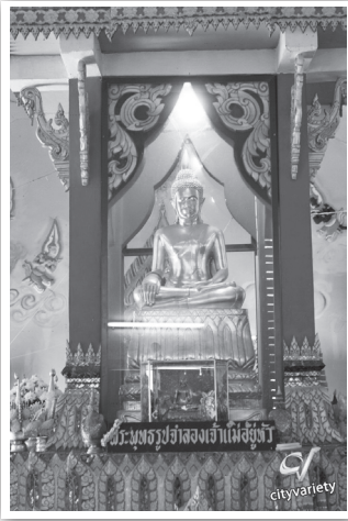
พระพุทธรูปจำลองเจ้าแม่อยู่หัว วัดท่าคุระ อ.สทิงพระ จ.สงขลา