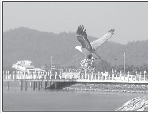
ภาพนกอินทรี อีกหนึ่งสัญลักษณ์แห่งเกาะลังกาวิ