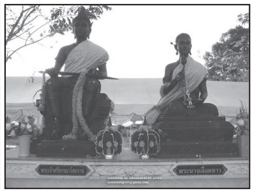
รูปเคารพพระนางเลียดขาว

วัดแม่เจ้าอยู่หัว อ.เชียรใหญ่ จ.นครศรีธรรมราช