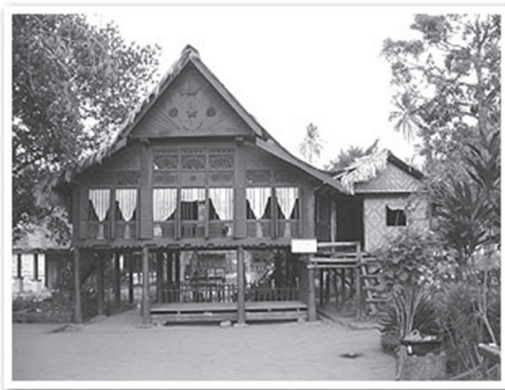
เรือนจำลองของพระนางมัสสุหรี หรือพระนางเลือดขาว (ประหลิมสุหรี) ตั้งอยู่หมู่บ้านแห่งหนึ่งห่างจากเมืองกัวท์ประมาณ 12 ก.ม.

พัฒนาเกาะลังกาวิให้เกิดการพัฒนาให้เป็นแหล่งท่องเที่ยวที่มีมนต์เสน่ห์โดยการหิบบวยเอาตำนานพระนางเลือดขาวมาเป็นหลักชัยในการดึงดูดนักท่องเที่ยว โดยได้มีการจัดสร้างสถานที่จำลองอันเกี่ยวเนื่องกับตำนาน เสมือนหนึ่งเป็นการนำเรื่องเล่าขานในตำนานมาเชื่อมโยงกับสถานที่เพื่อให้เป็นแหล่งท่องเที่ยวและศึกษาทางด้านประวัติศาสตร์ โดยบางสถานที่ได้มีการอ้างอิงทางประวัติศาสตร์ บางสถานที่ก็เป็นการสร้างจำลองเพื่อให้เห็นภาพเค้าลางตามตำนานบอกเล่า เช่น สถานที่ปักกริชพระพรหมนางมัสสุหรี บ้านจำลองของนางมัสสุหรี เป็นต้น ซึ่งถือเป็นการนำเรื่องเล่าและตำนานมาใช้เป็นเครื่องมือในการส่งเสริมการท่องเที่ยวสร้างรายได้และความร่ำรวยแก่ชาวเกาะลังกาวิอย่างเห็นได้ชัด โดยมีการเชื่อมโยงเอาตำนานมาอิงกับประวัติศาสตร์ และนำไปสู่การตามหาทายาทของมัสสุหรีรุ่นที่ 7 เพื่อลบคำสาปแห่งเกาะลังกาวิ เกิดการกระพือข่าวและสร้างกระแสความสนใจให้กับผู้คนถึงตำนานเรื่องเล่า ยิ่งทางการมาเลเซียได้ประกาศว่าพบทายาทรุ่นที่ 7 ของพระมัสสุหรี ซึ่งเป็นหญิงสาวชาวภูเก็ทที่ชื่อ สิรินทรา ยาหีย และมีพิธีกรรมล้างคำสาปจนเป็นที่โจษจัน ส่งผลให้ผู้คนหลั่งไหลสู่เกาะลังกาวิเพื่อไปเยือนถิ่นที่มีตำนานพระนางเลือดขาว จนพลิกฟื้นเศรษฐกิจของผู้คนชาวลังกาวิให้มีความมั่งคั่งและคึกคักกลับมาอีกครั้ง สอดคล้องตามตำนานพระนางเลือดขาวแห่งเกาะลังกาวิที่เล่าขานสืบต่อกันมา ซึ่งประเทศไทยยังไม่ประสบความสำเร็จในการหิบบวยหรือเชื่อมโยงตำนานสู่การต่อยอดให้เป็นแหล่งท่องเที่ยวและสามารถสร้างมูลค่าทางเศรษฐกิจได้โดดเด่นน้อยกว่าตำนานพระนางเลือดขาวแห่งเกาะลังกาวิ ประเทศมาเลเซีย