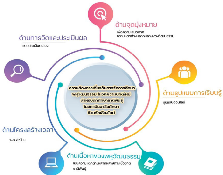
ภาพที่ 1 ภาพความต้องการในการจัดการศึกษาพหุวัฒนธรรม สำหรับนักศึกษาชาติพันธุ์ในสถาบันอาชีวศึกษา จังหวัดเชียงใหม่

เน้นความแตกต่างหลากหลายทางเชื้อชาติ ชาติพันธุ์ด้านรูปแบบการเรียนรู้การเรียนรู้พหุ วัฒนธรรมในวิถีความปกติใหม่ผู้เรียนต้องการ เรียนรู้ในรูปแบบออนไลน์ และด้านการวัดและ ประเมินผล ด้วยแบบประเมินตนเอง