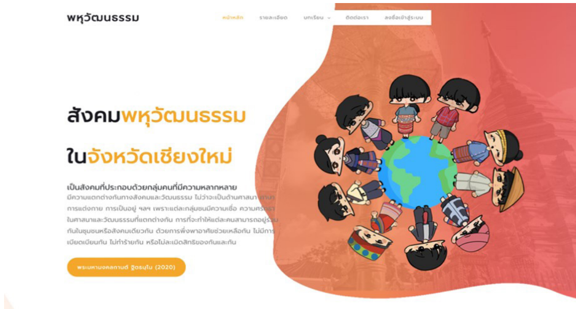
ภาพที่ 2 ภาพตัวอย่างนวัตกรรมส่งเสริมการเรียนรู้สังคมพหุวัฒนธรรมในวิถีความปกติใหม่สำหรับนักศึกษาชาติพันธุ์ในสถาบันอาชีวศึกษาจังหวัดเชียงใหม่