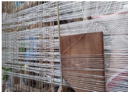
การเก็บเขา

แบบดั้งเดิมของช่างทอในล้านนา โดยใช้วิธีการยกเขาแทนการแกะลายผ้าทำให้การทอมีความงาม สะดวกและใช้เวลาในการทอต่อผืนน้อยกว่าการทอจก ซึ่งคุณภาพของผ้าทอแบบยกเขากับแบบทอจกไม่แตกต่างกัน และเมื่อทอออกมาเป็นผืนแล้วสามารถนำไปใช้ประโยชน์ได้อย่างหลากหลาย เช่น การนำไปต่อตีนผ้าขึ้น และการนำไปทำถุงย่าม เป็นต้น นอกจากนี้ยังสามารถนำไปตัดเย็บชุดเสื้อผ้าที่มีความทันสมัยได้ในหลากหลายรูปแบบ