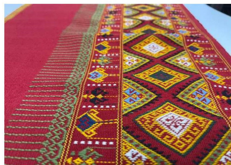
ภาพที่ 3 ลายผ้าทอดอกฝ้ายหงส์ดำที่ทอสำเร็จแล้ว

5. การประเมินคุณภาพลวดลายและผ้าทอต้นแบบจากผู้เชี่ยวชาญด้านผ้าทอสำนักงานวัฒนธรรมจังหวัดเชียงราย เจ้าของธุรกิจผ้าทอพื้น