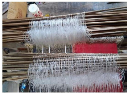
เครื่องยกเขาที่ทำสำเร็จ