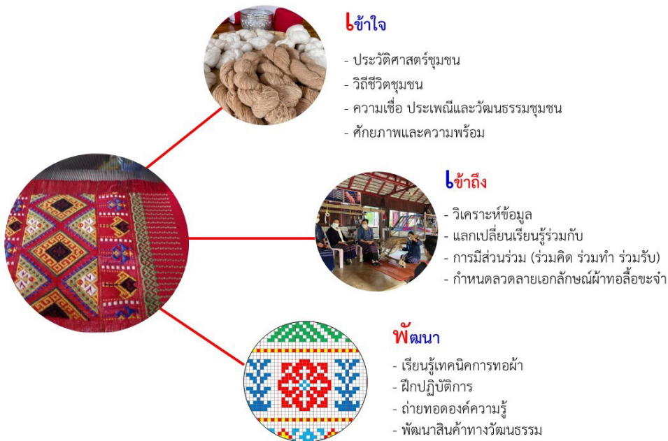
ภาพที่ 4 กระบวนการพัฒนาตลาดายเอกลักษณ์ผ้าทอลือชะจำ ชุมชนบ้านแม่ลอยหลวง

วัฒนธรรม และความมั่นคงทางอาชีพต่อไป ทั้งนี้ การศึกษาเพื่อพัฒนาตลาดายผ้าทอเอกลักษณ์ใน ครั้งนี้ สามารถสรุปขั้นตอนในการพัฒนาได้ 3 ขั้นตอน ได้แก่ 1) การเข้าถึง 2) การใจ และ 3) การ พัฒนา สามารถอธิบายได้ตามแผนภาพที่ 4