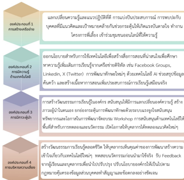
ภาพที่ 1 องค์ความรู้ที่ได้รับ