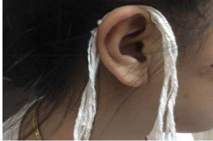
ภาพที่ 1 การนำฝ้ายผูกแขนคล้องหู

จากภาพเป็นการนำฝ้ายผูกแขนมาคล้องหู ซึ่งเป็นการสร้างสัญลักษณ์อย่างหนึ่ง กล่าวคือ แสดงให้เห็นว่าฝ้ายผูกแขนเป็นของสูงส่ง ศักดิ์สิทธิ์ จึงต้องนำมาคล้องไว้ที่หู เพื่อเป็นการให้ความเคารพในสิ่งที่เหนือสุดได้ สวดสัพพะวัณ ซึ่งประกอบด้วย การกล่าวถึงพระรัตนตรัย เทพเทวดาทั้งหลาย นอกจากนี้ยังมีความเชื่อว่าถ้านำฝ้ายผูกแขนไว้ที่ต่ำ หรือที่ที่ไม่เหมาะสม จะทำให้มนต์คาถาคำอวยพร ความเป็นสิริมงคลที่เหนือสุดสัพพะวัณได้สวดให้แผ่เข้าไปในเส้นฝ้าย จะเสื่อมสภาพไม่ต่างไปจากเส้นด้ายธรรมดาทั่วไป เมื่อนำมาผูกที่ข้อมือแล้วพลังอำนาจต่าง ๆ ย่อมไม่มีอยู่ในเส้นฝ้ายผูกแขนนั้นอีกต่อไป