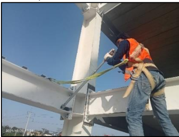
ภาพที่ 6 ทดสอบแรงบิดสลักเกลียว

กิจกรรมที่ -6 ปฏิบัติงานทดสอบแรงบิดของน็อต (Bolts) ที่ใช้เป็นตัวยึดชิ้นงาน ขั้นตอนย่อยอยู่ 2 ขั้นตอนคือ 1) ตรวจสอบขนาดของน็อตและแรงบิดที่ใช้ทดสอบ 2) ทดสอบแรงบิดด้วยประแจทดสอบแรงบิด เครื่องมือและวัสดุที่สำคัญคือ ประแจทดสอบแรงบิด นั่งร้าน บันไดทรง A และอุปกรณ์ป้องกันภัยส่วนบุคคล (PPE) เป็นต้น