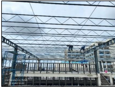
ภาพที่ 5 ติดตั้งแปเหล็ก

กิจกรรมที่ -5 ปฏิบัติงานติดตั้งแป (Purlin) รับหลังคาเมทัลชีท มีขั้นตอนย่อยอยู่ 3 ขั้นตอนคือ 1) ตรวจสอบความถูกต้องของชิ้นงาน 2) ยกชิ้นงานเข้าติดตั้งตามตำแหน่ง 3) เชื่อมแน่นแปติดกับจันทัน เครื่องจักรเครื่องมือและวัสดุที่สำคัญคือ รถโม่บาย เครน สายพานยกชิ้นงาน ส่วนชิ้นสลักเกลียว ตู้อเชื่อม และอุปกรณ์ป้องกันภัยส่วนบุคคล (PPE) เป็นต้น