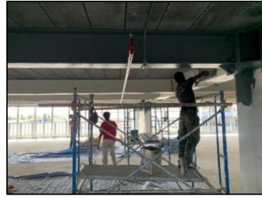
ภาพที่ 7 งานเก็บสีทาสี

กิจกรรมที่ -7 ปฏิบัติงานทาสีบริเวณรอยต่อหลังจากทดสอบแรงบิดแล้ว มีขั้นตอนย่อยอยู่ 1 ขั้นตอนคือ เก็บสีตามตำแหน่งที่ไม่เรียบร้อย เครื่องมือและวัสดุที่สำคัญ คือ นั่งร้าน ลูกกลิ้งทาสี และอุปกรณ์ป้องกันภัยส่วนบุคคล (PPE) เป็นต้น