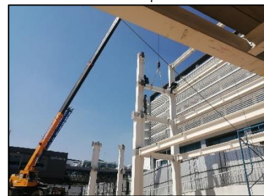
ภาพที่ 3 ติดตั้งคานเหล็กรูปพรรณ

กิจกรรมที่-3 ปฏิบัติงานประกอบชิ้นงาน ส่วนคาน (Beam) มีขั้นตอนย่อยอยู่ 3 ขั้นตอน คือ 1) ตรวจสอบความถูกต้องของชิ้นงาน 2) ยกชิ้นงานเข้าติดตั้งตามตำแหน่ง 3) ทำการติดตั้งสลักเกลียวยึดคานกับเสา มีเครื่องจักรเครื่องมือและวัสดุที่สำคัญคือ รถโมบายเครน สายพานยกชิ้นงาน ส่วนชั้นสลักเกลียว และอุปกรณ์ป้องกันภัยส่วนบุคคล (PPE) เป็นต้น