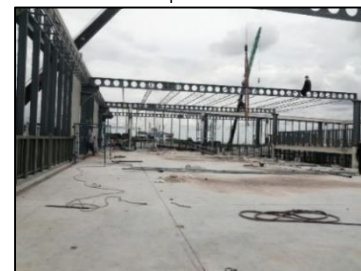
ภาพที่ 4 ติดตั้งแปเหล็ก

กิจกรรมที่-4 ปฏิบัติงานประกอบชิ้นงาน ส่วนจันทัน (Rafter) ในส่วนหลังคา มีขั้นตอนย่อยอยู่ 4 ขั้นตอนคือ 1) ตรวจสอบความถูกต้องของชิ้นงาน 2) ประกอบจันทัน 3) ยกจันทันขึ้นติดตั้งตามตำแหน่ง 4) ยกจันทันกับหัวเสาด้วยสลักเกลียว เครื่องจักรเครื่องมือและวัสดุที่สำคัญคือ รถโมบายเครน สายพานยกชิ้นงาน ส่วนชั้นสลักเกลียว และอุปกรณ์ป้องกันภัยส่วนบุคคล (PPE) เป็นต้น