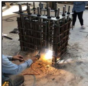
ภาพที่ 1 การติดตั้ง Anchor Bolts

กิจกรรมที่-1 ปฏิบัติงานติดตั้ง Anchor Bolts มีขั้นตอนย่อยอยู่ 3 ขั้นตอนคือ 1) การหาระดับและแนวอ้างอิงตามแบบอาคาร 2) วาง Template ให้ได้ระดับและแนวที่หาไว้ 3) ทำการติดตั้ง Anchor Bolts โดยการเชื่อมติดกับเหล็กทอม่อ เครื่องมือและวัสดุที่สำคัญคือ กล้องระดับ กล้องวัดมุม ตู้อเชื่อม อุปกรณ์ป้องกันภัยส่วนบุคคล (PPE) เป็นต้น