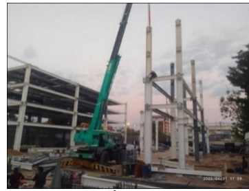
ภาพที่ 2 ติดตั้งเสาเหล็กรูปพรรณ

กิจกรรมที่-2 ปฏิบัติงานติดตั้งเสา (Column) เหล็กรูปพรรณ มีขั้นตอนย่อยอยู่ 4 ขั้นตอนคือ 1) ตรวจสอบความถูกต้องของชิ้นงาน 2) ยกชิ้นงานเข้าติดตั้งตามตำแหน่ง 3) ตรวจสอบดิ่งเสา 4) ชันสลักเกลียวเพื่อยึดเสาเข้ากับ Anchor Bolts มีเครื่องจักรเครื่องมือและวัสดุที่สำคัญคือ รถโมบายเครน สายพานยกชิ้นงาน ดิ่ง ส่วนชั้นสลักเกลียว และอุปกรณ์ป้องกันภัยส่วนบุคคล (PPE) เป็นต้น