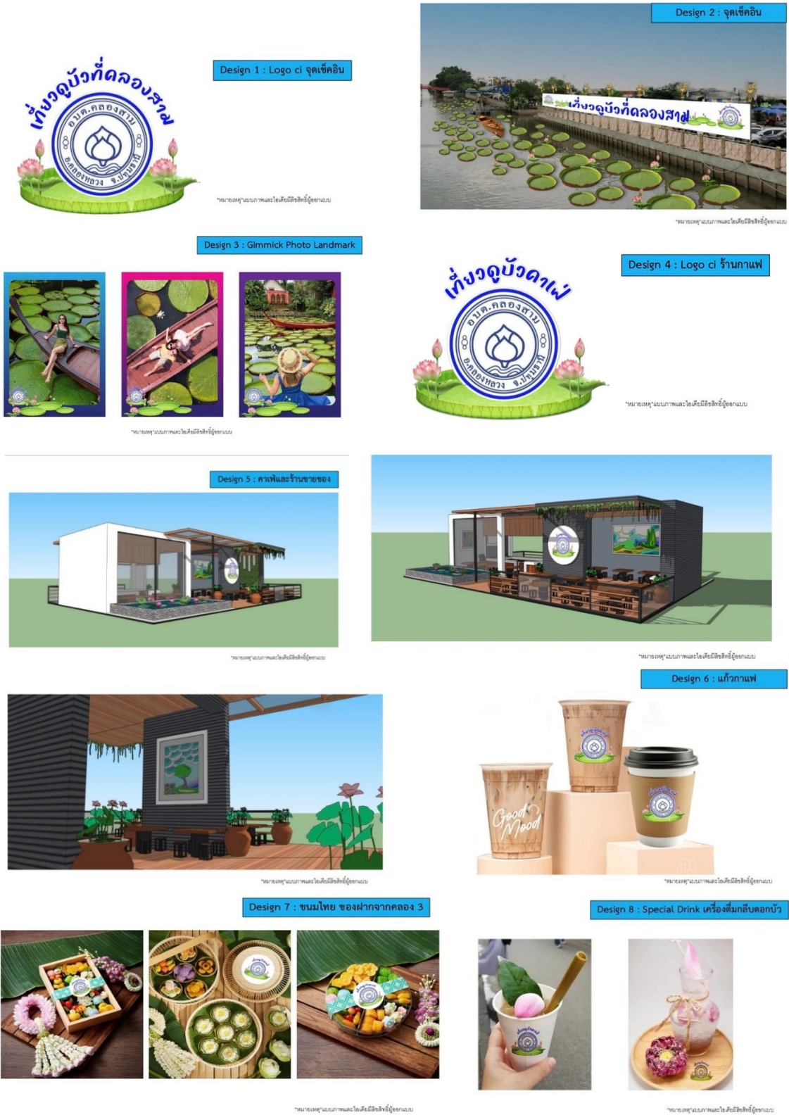
ภาพที่ 2 ออกแบบจุดเช็คอิน (Chack in) ร้านอาหาร “มองดูบัว”

เป็นแหล่งที่มาในการออกแบบจุดเช็คอิน (Chack in) ร้านอาหาร “มองดูบัว” เช่น อาหารที่ใช้ส่วนประกอบของบัว ทัศนกรรมที่มีสัญลักษณ์ของบัว เครื่องดื่มที่ทำจากบัว ขนมที่ทำจากบัว และร้านอาหาร จุดเช็คอินที่เป็นสัญลักษณ์ของบัว มาเป็นส่วนประกอบและยกระดับอย่างจริงจังและใช้เป็นแหล่งเผยแพร่ซอฟต์แวร์ด้านอื่น ๆ เพื่อเชื่อมโยงการท่องเที่ยวต่อไป ซึ่งผู้วิจัยได้ทดลองสร้างรูปแบบจุดเช็คอิน (Chack in) ดังภาพต่อไปนี้