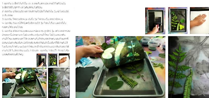
ภาพที่ 3 ขั้นตอนการทดลองการพิมพ์ภาพด้วยหมึกพิมพ์ใช้น้ำมัน

ศิลป์และเพื่อหาหลักการวัดคุณค่าด้วยภาพชิ้นงานที่ประจักษ์ขึ้นจริงหรือให้เหตุเปรียบเทียบให้เป็นไปตามกระบวนการพิมพ์ภาพที่มีผลลัพท์ในลักษณะคล้ายคลึง หรือ อาจจะมีลักษณะที่ปรากฏเช่นเดียวกัน คือการสร้างด้วยกรรมวิธีการพิมพ์ผิวนูน (Relief print process to positive) หรือภาพพิมพ์แม่พิมพ์วัสดุพิมพ์โดยการใช้แทนพิมพ์ใช้น้ำหนักกดทับด้วยแรงของกลไกเครื่องพิมพ์ และกรรมวิธีการพิมพ์พื้นราบ (Planography print process to negative) หรือ เทคนิคภาพพิมพ์หิน/ลิโทกราฟี ที่มีลักษณะของกระบวนการเช่นเดียวกัน คือ การใช้แทนพิมพ์ใช้น้ำหนักกดทับด้วยแรงของกลไกเครื่องพิมพ์ ตัวอย่างที่นำมาเปรียบเทียบผู้วิจัยยังไม่สามารถรองรับเหตุและผล หรือยืนยันการเปรียบเทียบให้เกิดเป็นลำดับตีมากกว่า หรือ ดีกว่าเทคนิคที่หยิบยกมาเป็นตัวอย่างได้ เพียงเพื่อนำเสนอถึงความงามตามเหตุผลจากประสบการณ์ของผู้วิจัยเท่านั้น พร้อมการสร้างความเข้าใจและยังต้องใช้เวลาเพื่อค้นคว้าให้ได้ถึงการยอมรับในสังคมตามความเหมาะสมของเทคนิคนี้ต่อไป