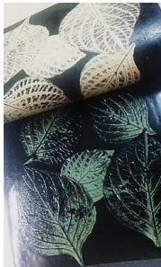
พื้นรองรับ

(วัสดุ/พื้นผิว) (เพลทเจลลาติน/แท่นพิมพ์)