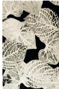
ผลงานภาพพิมพ์หรือการพิมพ์ภาพเพื่อสร้างจำนวน