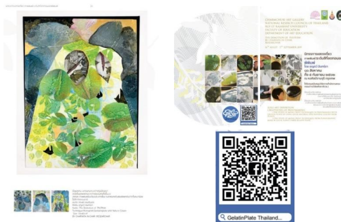
ภาพที่ 8 ตัวอย่างงานสร้างสรรค์พร้อมการเผยแพร่ข้อมูลเพื่อการศึกษาเพิ่มเติม ที่มา: หน้าปกสูจิบัตรการแสดงนิทรรศการเดี่ยว ณ หอศิลป์จามจุรี จุฬาลงกรณ์มหาวิทยาลัย การศึกษาศิลปะภาพพิมพ์เทคนิคเพลทแม่พิมพ์เจลาตินด้วยการใช้สีธรรมชาติ ในท้องถิ่นของมหาวิทยาลัยราชภัฏร้อยเอ็ด.ปีงบประมาณ วช.61

การศึกษาวิธีการเตรียมเพลทวุ้นเจลาตินและสามารถติดตามบทความ งานเอกสาร หรืองานวิจัยที่มีรายละเอียดขั้นตอนของเทคนิคภาพพิมพ์แทนพิมพ์เจลาตินเช่นนี้ต่อไป จากทุนงานวิจัยสำนักงานวิจัยแห่งชาติปีงบประมาณ 2561 ชื่อโครงการวิจัย “การศึกษาศิลปะ ภาพพิมพ์เทคนิคเพลทแม่พิมพ์เจลาติน ด้วยการใช้สีธรรมชาติในท้องถิ่นของมหาวิทยาลัย ราชภัฏร้อยเอ็ด” เพื่อใช้เป็นแทนพิมพ์แผ่นเพลทที่ดีจะมีลักษณะผิวนุ่มและรู้สึกเหมือนวัน อ่อน ๆ สามารถเก็บที่อุณหภูมิห้องซึ่งง่ายต่อการพิมพ์ครั้งต่อไป แต่จำกัดจำนวนครั้งตาม คงทนของเพลทแม่พิมพ์ เพราะฉะนั้น จึงต้องหาส่วนผสมในท้องถิ่นเพิ่มเติมเล็กน้อย วิธีการ คัดเลือกวัสดุแม่พิมพ์ธรรมชาติและขั้นตอนการสร้างสรรคผลงาน โดยการเลือกวัสดุแม่พิมพ์ ควรกำหนดให้เป็นชุดการพิมพ์ที่มีองค์ประกอบภาพจากการใช้วัสดุนั้น ๆ ชนบก เส้นด้าย หรือเส้นไหม ใบไม้ ลายฉลุตัดจากกระดาษ แผ่นเปลือกไม้บาง ๆ หรือแผ่นกระดาษแข็ง เป็น หมึกพิมพ์ชนิดเขื่อน้ำมัน สามารถนำเสนอเป็นนิทรรศการพร้อมด้วยผลงานสร้างสรรค์ในรูปแบบศิลปกรรมภาพพิมพ์เทคนิคการพิมพ์ขึ้นเดียวได้ อธิบายการต่อยอดการคิดวิเคราะห์ หาประเด็นนิยามความหมายบรรยายภาษาไทยระหว่างคำว่าแทนพิมพ์เจลาตินเพลทหรือ แม่พิมพ์เจลาตินเพลทจากคำแนะนำของคณะกรรมการในระหว่างการนำเสนอบทความทาง วิชาการครั้งนี้ในโอกาสต่อไป