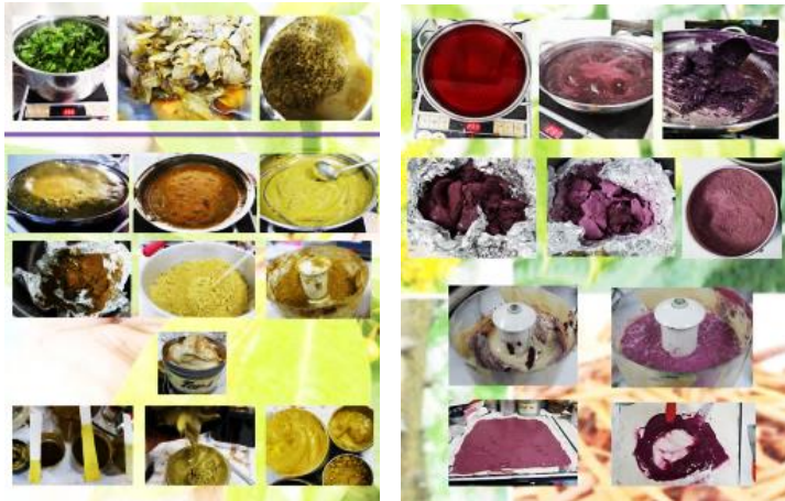
ภาพที่ 5 ขั้นตอนการสกัดสีจากใบมะม่วงและแก่นฝาง

ใบยูคาลิปตัส หรือน้ำสนิมเหล็ก แล้วใช้ความร้อนเป็นกรรมวิธีการสกัดสีหรือใช้อุณหภูมิเป็นหลัก เพื่อเร่งปฏิกิริยาการกลั่นตัวเม็ดสี หากต้องการลดระยะเวลาการต้มสามารถกระทำได้โดยวิธีการโหลกบด การทุบ การปั่นละเอียดแล้วใช้ความร้อนในอุณหภูมิที่พอเหมาะให้ได้เม็ดสีจากพืชนั้น ๆ