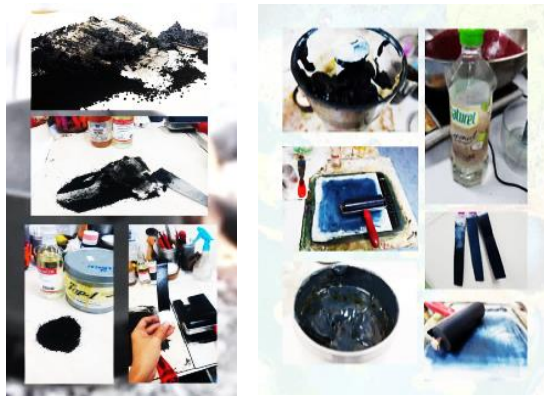
ภาพที่ 6 ขั้นตอนการใช้สีจากธรรมชาติด้วยการใช้รูปแบบที่ 2 จากเขม่าควันและเนื้อคราม ที่มา: ชญุตว์ อินทร์ชา (2561)

สีน้ำเงิน การใช้สีจากครามด้วยการทำครามก่อนจากเนื้อครามที่ใช้ในการทดลอง เป็นครามเปียก คือ เนื้อครามที่ยังอยู่ในกระบวนการเปลี่ยนสถานะ เนื้อครามที่นำมาใช้ไม่ได้ รวมถึงขั้นตอนการก่หม้อเพื่อการย้อม แต่ถ้าหากเพิ่มกระบวนการก่หม้อแล้วนำครามที่ได้ จากก่หม้อมาได้นั้น ซึ่งจะเป็นส่วนดีในด้านการเลือกเฉดสีอื่น ๆ เข้ามาได้ เนื้อครามมีลักษณะ เป็นเนื้อเหลวลึ้มคล้ายเนื้อสีทั่วไป เพราะเป็นของเหลวที่มีลักษณะของความเข้มข้นของเนื้อสี หรือความข้นของเนื้อปูนขาวซึ่งได้รับจากการสกัดแยกสีด้วยวิธีการหมักแบบพื้นบ้านจาก จังหวัดสกลนคร สีครามเป็นสีที่ผู้วิจัยใช้วิธีปฏิบัติการสร้างสีภาพพิมพ์ในสำหรับการวิจัยครั้งนี้ ด้วยรูปแบบที่ 2