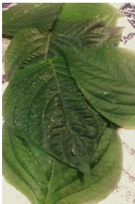
ชนิดแม่พิมพ์

รูปร่าง พื้นผิว ความเหมาะสมของแม่พิมพ์ที่เลือกมาก็เป็นปัจจัยสำคัญที่ควรคำนึงเช่นกัน แถวนขวา คือ ขั้นตอนการประกบกระดาษหรือวัสดุรองรับการพิมพ์เป็นผลงานภาพพิมพ์ หรือการพิมพ์ภาพเพื่อสร้างจำนวน แล้วใช้น้ำหนักมือการกดให้ติดเพื่อให้ได้ภาพพิมพ์ด้วยการ ลูบด้วยฝ่ามือ แถวล่างซ้าย คือ การแสดงให้ทราบถึงการพิมพ์ในขั้นตอนแรกซึ่งการลงหมึก เพียงครั้งเดียวสามารถใช้ลักษณะการพิมพ์ให้ได้ผลลัพธ์ถึง 2 ลักษณะ ขั้นตอนนี้จะได้ผลลัพธ์ เป็นลักษณะสีส่วนนอกแม่พิมพ์ หรือ ใช้เรียกคำเฉพาะเทคนิคว่า Positives แถวล่างขวา คือ การแสดงให้ทราบถึงการพิมพ์ในขั้นตอนที่ 2 จากการยกแม่พิมพ์ออกจากแท่นพิมพ์ และด้วยการลงหมึกเพียงครั้งเดียวสามารถใช้ลักษณะการพิมพ์ให้ได้ผลลัพธ์ถึง 2 ลักษณะ ขั้นตอนนี้ จะได้ผลลัพธ์เป็นลักษณะสีส่วนพื้นผิวของแม่พิมพ์ หรือเรียกว่า Negatives มากจากความหมายว่า ส่วนใน ส่วนลึกลงเอง