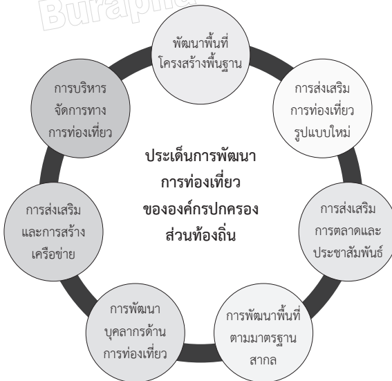
ภาพที่ 3 ประเด็นการพัฒนา การท่องเที่ยวขององค์กรปกครองส่วนท้องถิ่น

ผู้วิจัยได้ศึกษาวิเคราะห์เอกสารจากแหล่งข้อมูลทุติยภูมิ (Secondary data) จากแผนยุทธศาสตร์ (Secondary document) และเอกสารสาธารณะ (Public document) ที่เขียน และตีพิมพ์โดยองค์กรปกครองส่วนท้องถิ่น ผลการศึกษาพบว่า องค์กรปกครองส่วนท้องถิ่นมียุทธศาสตร์การพัฒนาและส่งเสริมด้านการท่องเที่ยวของท้องถิ่น โดยนำเสนอผ่านแผนยุทธศาสตร์ (Secondary document) และเอกสารสาธารณะ (Public document) สามารถสรุปประเด็นสำคัญได้ 7 ประเด็น ได้แก่ 1) การพัฒนาโครงสร้างพื้นฐาน 2) การส่งเสริมการท่องเที่ยวรูปแบบใหม่ 3) การส่งเสริมการตลาดและการประชาสัมพันธ์ 4) การพัฒนาพื้นที่ให้มีมาตรฐานตามหลักสากล 5) การพัฒนาบุคลากรทางการท่องเที่ยว 6) การสร้างภาคีเครือข่าย และ 7) การบริหารจัดการทางการท่องเที่ยว มีรายละเอียดดังภาพที่ 3