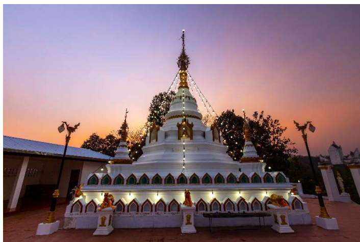
วัดจอมกิตติ

หมายเหตุ. ถ่ายภาพเมื่อวันที่ 20 มีนาคม พ.ศ. 2565