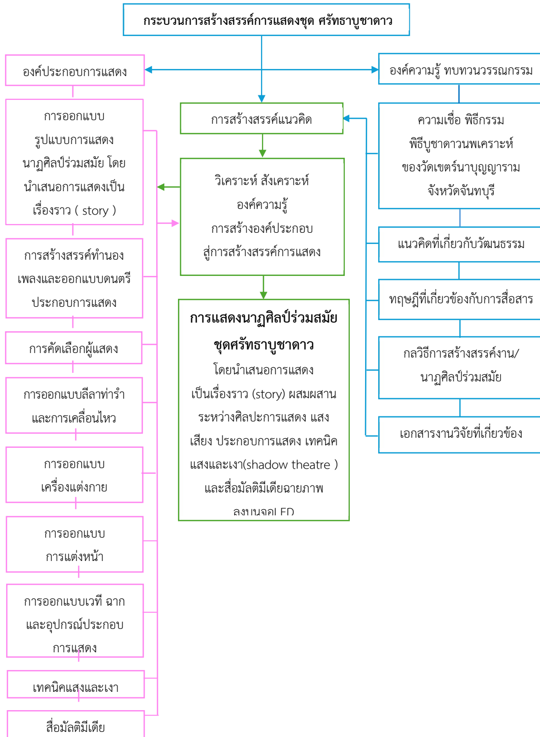
ภาพที่ 3 สรุปกระบวนการการแสดงสร้างสรรค์ ชุด ศรัทธาบูชาดาว