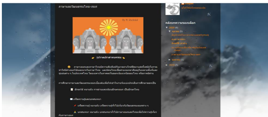
รูปที่ 1 การสร้าง blog เพื่อใช้เป็นสื่อการเรียนการสอนออนไลน์กลุ่มภาษาและวัฒนธรรมเขมร

ซึ่งผลการพัฒนาสื่อทำให้ได้ชุดการเรียนภาษาและวัฒนธรรมเขมรผ่านระบบ e learning และ blog ต่างเป็นชุดการเรียนรู้อีกคือ 1) อักษรวิจิตรเขมร 2) สัตว์ในวรรณคดีเขมร 3) อาหารเขมร 4) เครื่องแต่งกายเขมร 5) ประเพณีและเทศกาลเขมร 6) แหล่งท่องเที่ยวในกัมพูชา 7) บทกวีและดนตรีเขมร 8) ไวรัสโควิด 19