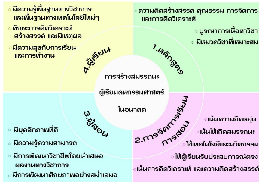
แผนภาพที่ 3 กรอบการพัฒนาผู้เรียนคหกรรมศาสตร์เพื่อสร้างสมรรถนะในศตวรรษที่ 21

สร้างองค์ความรู้จากการปฏิบัติจริง ปรับตัวและอยู่ร่วมกันอย่างมีความสุข บนฐานวิถีชีวิตใหม่และยั่งยืน ซึ่งได้สรุป กรอบการพัฒนาผู้เรียนคหกรรมศาสตร์เพื่อสร้างสมรรถนะในศตวรรษที่ 21 ไว้ดังรูปที่ 3