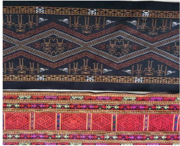
รูปที่ 1 พิพิธภัณฑสถานแห่งชาติให้หนาน ค.ศ. 2021 – ผู้เขียน