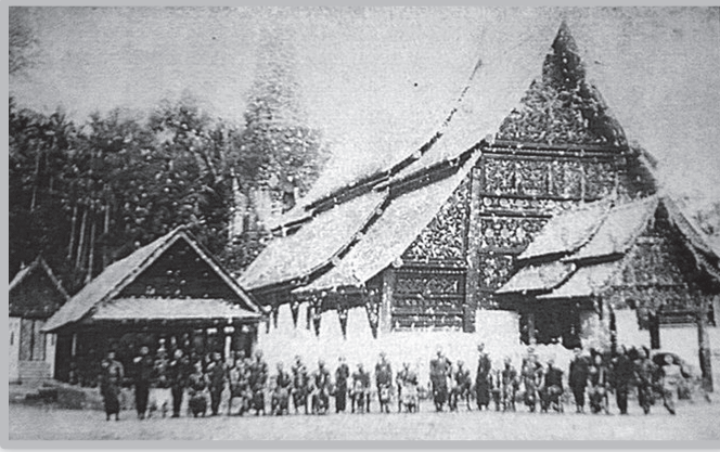
วัดหลวงเมืองมาน หรือ วัดพระหลวง ถ่าย พ.ศ.๒๔๖๐

มานั้นเปนของเก่าโบราณมาแต่เดิม ทำบุญแลกินทานแล้วข้าก่อกำแพงแถม ๒ ด้านหน้าหลังบอรวมณแล้ว ใส่นามวัดชื่อว่าวัดหลวงเมืองมาน...” ๖๔