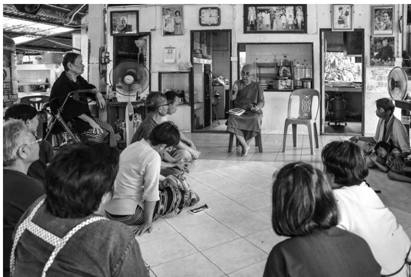
ภาพที่ 5 กลุ่มญาติธรรมกำลังเช็คศีล