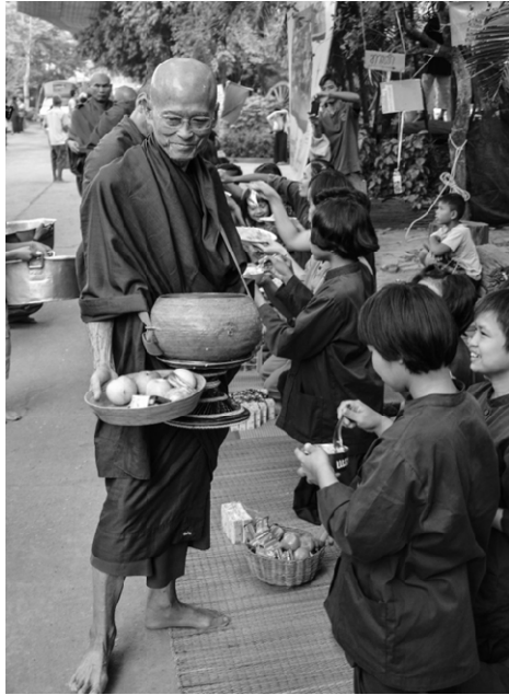
ภาพที่ 2 สมณะโพธิรักษ์ ผู้นำชาวอโศก