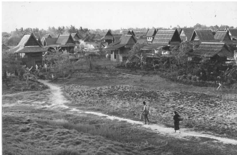
ภาพที่ 3 พุทธสถานปฐมอโศกใน พ.ศ. 2528