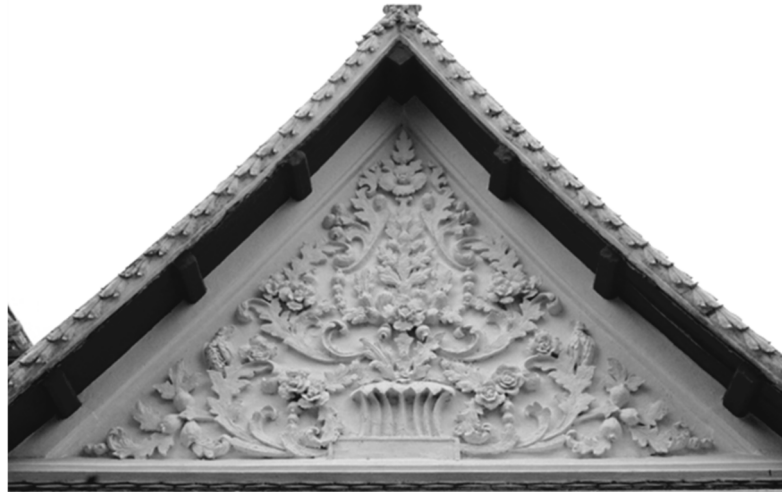
ภาพที่ 6 ปูนปั้นลายหน้าบันศาลาการเปรียญ วัดสุทัศนเทพวรารามราชวรมหาวิหาร กรุงเทพฯ