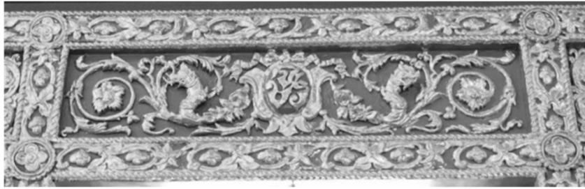
ภาพที่ 9 กรอบลวดลายปูนปั้นประดับบริเวณเหนือช่องประตูหน้าต่าง ภายในพระอุโบสถวัดราชบพิธสถิตมหาสีมาราม กรุงเทพฯ