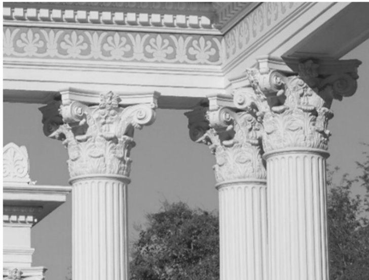
ภาพที่ 12 เสาแบบคอมโพสิต (Composite) ที่ตกแต่งหัวเสาด้วย ลวดลายใบอะแคนดัส จากสวนโรมัน ภายในพระราชวังพญาไท กรุงเทพฯ