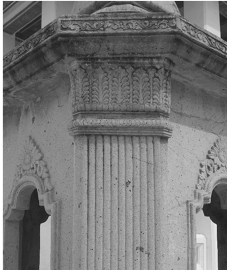
ภาพที่ 7 เสาประดับจากเรือนซุ้มเสมา ที่พระอุโบสถวัดกัลยาณมิตรวรมหาวิหาร กรุงเทพฯ