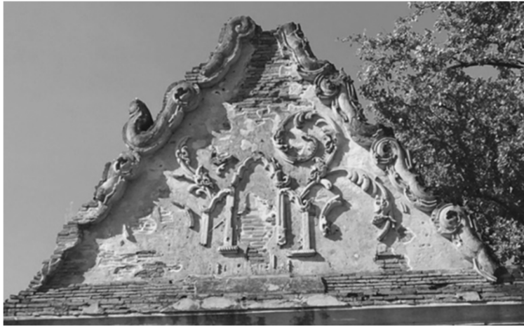
ภาพที่ 3 ลวดลายปูนปั้นประดับหน้าบันวัดเตวีต จังหวัดพระนครศรีอยุธยา