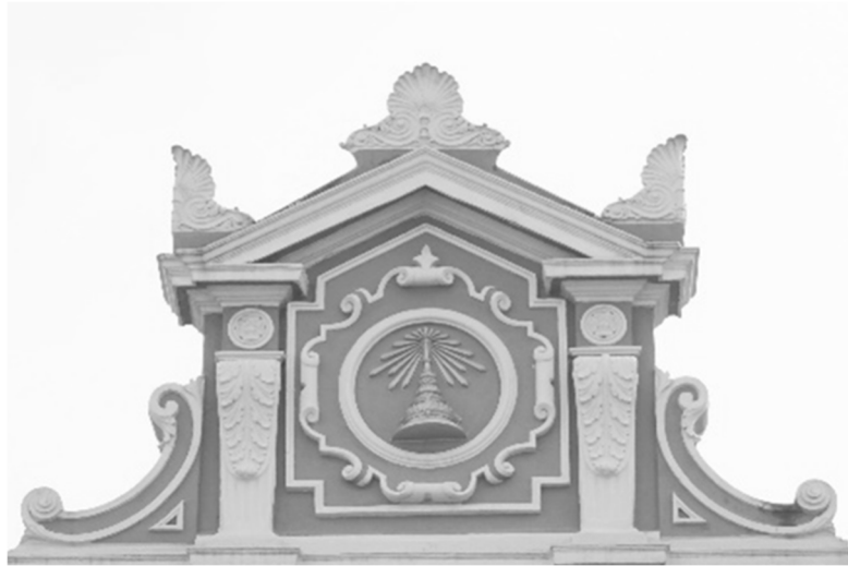
ภาพที่ 11 ซุ้มหน้าจั่วมุขบริเวณโถงทางเข้าอาคาร กรมแผนที่ทหาร กรุงเทพฯ