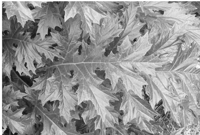
ภาพที่ 1 ใบของต้นอะแคนดัส ( Acanthus mollis L.)