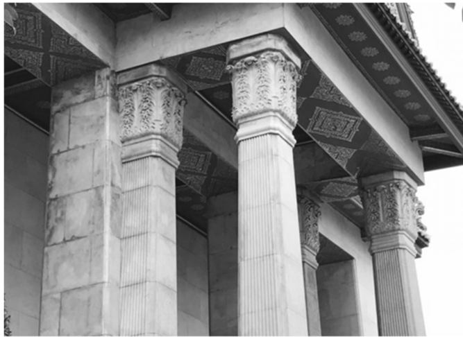
ภาพที่ 8 เสาแบบตะวันตกทั้ง 4 ต้น ที่มุขหน้าของพระอุโบสถวัดบวรนิเวศวิหาร กรุงเทพฯ