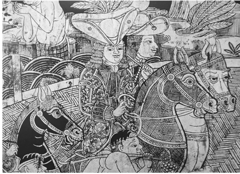
ภาพที่ 5 ภาพลายรดน้ำรูปทหารชาวฝรั่งเศสบนฝาดำหนัก ที่หอเขียนวังสวางค์กาด กรุงเทพฯ (Leksukhum 2000: 92)