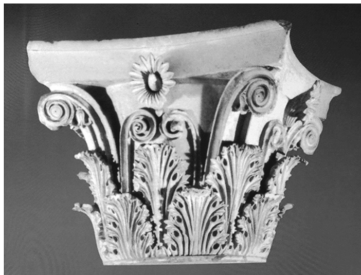
ภาพที่ 2 หัวเสาแบบโครินเธียน ศิลปะกรีก จากเทวสถาน Tholos ในเมือง Epidaurus ประเทศกรีก ประมาณ 350 ปี ก่อนคริสต์ศักราช (John Lu 2020)