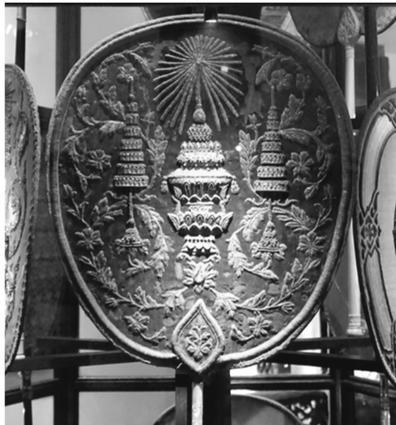
ภาพที่ 10 พัดรองที่ระลึกในงานสมโภชภาคภิเษกพระบาทสมเด็จพระจุลจอมเกล้า เจ้าอยู่หัว ครองราชสมบัติเป็นระยะเวลาเสมอด้วยพระบาทสมเด็จพระจอมเกล้า เจ้าอยู่หัว พ.ศ. 2428 พิพิธภัณฑสถานแห่งชาติ พระนคร กรุงเทพฯ