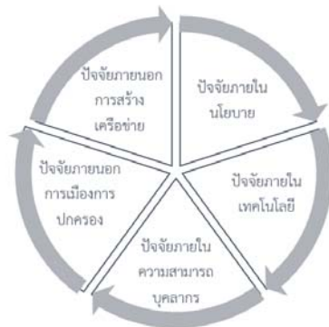
ภาพที่ 2 ปัจจัยที่ส่งผลกระทบต่อรูปแบบการจัดองค์กร และเนื้อหาของสื่อสารมวลชน ตามแนวความคิดของ Mc Quails

ผู้เขียนวิเคราะห์ว่าเกิดจากปัจจัยภายในและปัจจัยภายนอกที่ส่งผลกระทบต่อรูปแบบการจัดการองค์กรและเนื้อหาของสื่อสารมวลชน ตามแนวความคิดของ Mc Quails (2005) ดังนี้