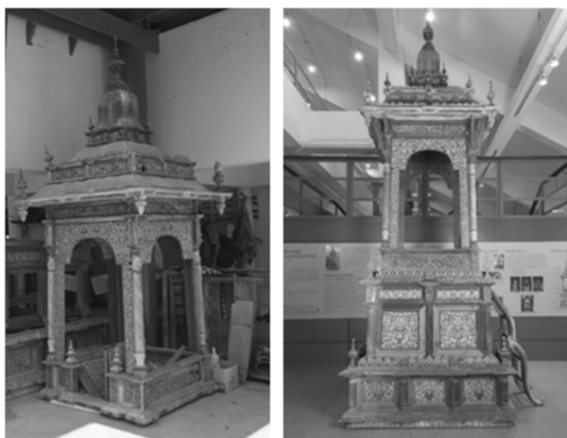
ภาพที่ 1 ธรรมาสน์ทรงบุษบกวัดท่าศาลาราม ในพิพิธภัณฑ์ธรรมศาสตร์เฉลิมพระเกียรติ ก่อนและหลังการอนุรักษ์