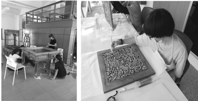
ภาพที่ 5 อาสาสมัครทำความสะอาดชิ้นส่วนและโครงสร้างธรรมาสน์