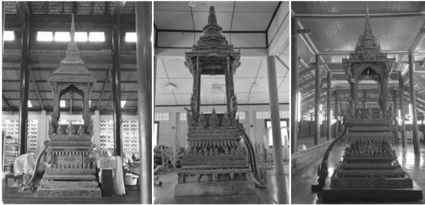
ภาพที่ 24 (ซ้าย) ธรรมาสถูปาวัดใหม่เจริญธรรม พ.ศ. 2493 (กลาง) ธรรมาสถูปาวัดชลูป พ.ศ. 2495 และ (ขวา) ธรรมาสถูปาวัดหนองไม้เหล็ก พ.ศ. 2500 ตามลำดับ

คณะผู้วิจัยพบว่าธรรมาสถูปาในยุคสุดท้ายนี้ มีธรรมาสถูปาจำนวนมากที่ไม่สามารถจัดจำแนกออกเป็นกลุ่มต่าง ๆ ได้ชัดเจนเหมือนยุคก่อนหน้า รวมถึงการนำธรรมาสถูปาจากเสาชิงช้าและที่อื่น ๆ ที่สร้างธรรมาสถูปาสำเร็จรูปมาประดิษฐานไว้บนศาลาการเปรียญแทนที่การว่าจ้างช่างในเมืองเพชรบุรี เช่น ธรรมาสถูปาวัดธงไชย พ.ศ. 2498 ธรรมาสถูปาวัดลาดศรีพร้าธรรม พ.ศ. 2502 ธรรมาสถูปาวัดอินทาราม (บ้านขลุ่ย) พ.ศ. 2502 ธรรมาสถูปาวัดกุฎีดาว พ.ศ. 2504 ธรรมาสถูปาวัดประดิษฐวราราม พ.ศ. 2505 แสดงให้เห็นได้อย่างชัดเจนว่า ช่างที่มีความเชี่ยวชาญในการออกแบบและแกะสลักสร้างธรรมาสถูปาไม่เหลืออีกต่อไปแล้วในเมืองเพชรบุรี อีกทั้งความนิยมในการสร้างธรรมาสถูปาได้ลดน้อยลงจนไม่มีการสร้างธรรมาสถูปาอีกในเวลาต่อมา