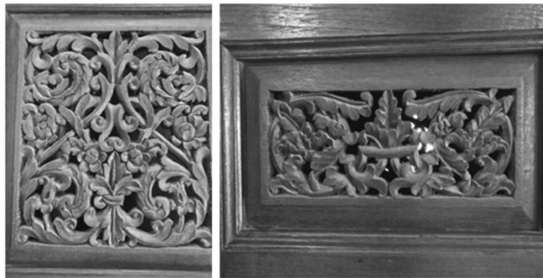
ภาพที่ 9 ลายแกะสลักประดับศาลาการเปรียญวัดพลับพลาชัย พ.ศ. 2465 - 2466