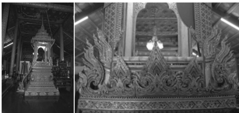
ภาพที่ 17 ตัวธรรมาสน์และลวดลายกระจัดวัดเกาะ สร้าง พ.ศ. 2465

นอกจากจะมีกระจัดปฏิญานที่ต่างจากที่อื่นแล้ว ยังมีการเพิ่มสัตว์ชนิดต่าง ๆ ไว้บริเวณมุมทั้ง 4 ด้านของล่องธรรมาสน์ที่มักจะเป็น ครุฑ หนูมาน หรือนกรวิก และฐานรับบันไดนาค ก็จะมีสัตว์ตามป็นกษัตริมารองบันไดอีกที ซึ่งอาจจะเป็นเสือหนู ลิง หรือแพะ ธรรมาสน์ที่วัดนาพรหม พ.ศ. 2465 ไม่มีประวัติการสร้างที่ละเอียดแบบวัดเกาะ แต่มีลักษณะต่าง ๆ ที่ใกล้เคียงอย่างมากกับธรรมาสน์วัดเกาะ ซึ่งอาจได้รับอิทธิพลจากงานวัดเกาะก็เป็นได้ แต่ฝีมือการแกะสลักลวดลาย และตัวแบกที่เป็นครุฑทั้ง 4 ด้านนั้นยังเทียบกันไม่ได้กับฝีมือของทางวัดเกาะ