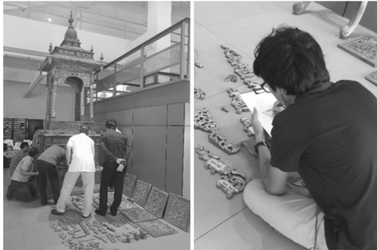
ภาพที่ 2 จัดวางธรรมาสน์และทำทะเบียนชิ้นส่วนต่าง ๆ