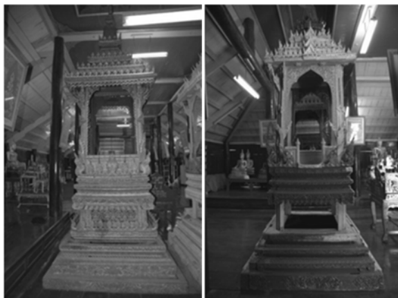
ภาพที่ 15 ธรรมาสน์วัดพระทรง จำนวน 2 หลัง สร้าง พ.ศ. 2460

คณะผู้วิจัยพบว่า ธรรมาสน์ในตอนต้นนี้สร้างอยู่ทั่วไปในเมืองเพชรบุรีและพื้นที่โดยรอบที่มีความสัมพันธ์กันในเชิงสหธรรมิกระหว่างวัดในตัวเมืองเพชรกับวัดรอบนอกเมืองเพชรบุรี ทำให้พบหลักฐานการสร้างธรรมาสน์ที่สัมพันธ์กันในเชิงช่างระหว่างวัดรอบนอกเมืองเพชรกับวัดในเมืองเพชร ธรรมาสน์ 2 หลังที่วัดพระทรง (ดูภาพที่ 15) ผลงานของขุนศรีวิงยศในฐานะผู้ออกแบบ มีพระอาจารย์เป้า ปญโญเป็นผู้แกะสลักร่วมกับช่างของวัดพระทรง ตั้งคู่กันในศาลาการเปรียญ มีรูปแบบทางศิลปกรรมที่สวยงามมาก (Na Paknham 2001) ใน พ.ศ. 2460 ซึ่งถือได้ว่าเป็นต้นแบบสำคัญให้กับธรรมาสน์หลังต่อ ๆ มาหลังจากนี้ ผลงานของขุนศรีวิงยศยังมีที่วัดคงคาราม พ.ศ. 2461 และธรรมาสน์วัดแรก พ.ศ. 2461 (ดูภาพที่ 16) สังเกตลวดลาย รูปทรง และสีสันทันส่วนใหญ่เน้นสีเขียว หากพิจารณาดูให้ดีจะเห็นว่า ธรรมาสน์ของกลุ่มช่างวัดพระทรงแสดงให้เห็นแรงบันดาลใจบางอย่างของช่างผู้สร้างที่ได้รับอิทธิพลทางความคิดมาจากศิลปกรรมสมัยอยุธยาแล้วนำมาปรับใช้ให้เข้ากับรสนิยมท้องถิ่นและรูปแบบศิลปกรรมสมัยรัตนโกสินทร์ได้อย่างลงตัวและเป็นลักษณะที่นิยมร่วมกันในเมืองเพชรบุรี