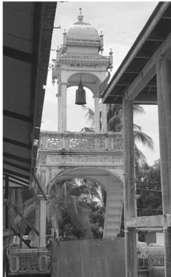
ภาพที่ 11 หอรบั้งวัดชีวีประเสริฐ