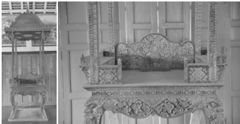
ภาพที่ 18 รูปทรงธรรมาสน์วัดหัวสะพาน พ.ศ. 2468

ลวดลายที่ต่างกัน และฝีมือของช่างยังถือว่าต่างไปจากธรรมาสน์วัดพระทรงและ วัดคงคารามค่อนข้างมาก