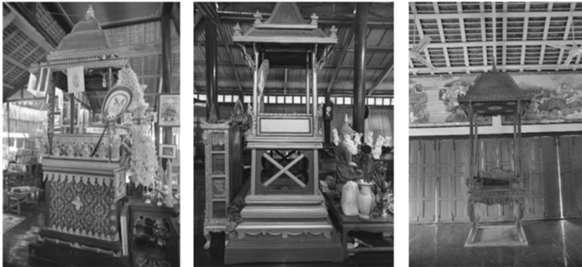
ภาพที่ 8 (ซ้าย) ธรรมาสน์บนศาลาคามวาสี (กลาง) ธรรมาสน์วัดไม้รวกสุขาราม และ (ขวา) ธรรมาสน์วัดหัวสะพาน ตามลำดับ