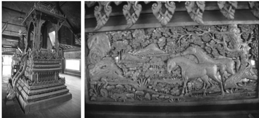
ภาพที่ 19 ตัวธรรมาสน์และลายทิวทัศน์บนล่องถุน วัดลาด พ.ศ. 2469