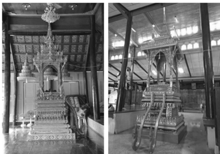
ภาพที่ 22 (ซ้าย) ธรรมาสน์วัดสามะโรง พ.ศ. 2478 และ (ขวา) ธรรมาสน์วัดหนองควง พ.ศ. 2478 ตามลำดับ