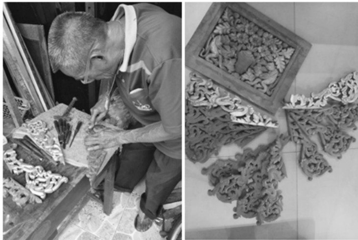
ภาพที่ 4 ช่างดำเนินการแกะสลัก