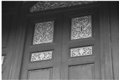
ภาพที่ 10 ลายแกะสลักประดับศาลาการเปรียญ วัดทองนพคุณ