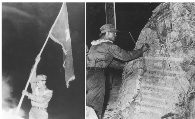
ภาพที่ 2 ในหลวงรัชกาลที่ 9 ปกธรงราชนาวิกโยธินที่ชายหาดอ่าวนาวิกโยธิน อำเภอสัตหีบใน พ.ศ. 2509

เชื่อมโยงกับบริบทความมั่นคงและการทหารในยุคที่ฝ่ายคอมมิวนิสต์กำลังโอบล้อม ไทยจากทางตะวันออก