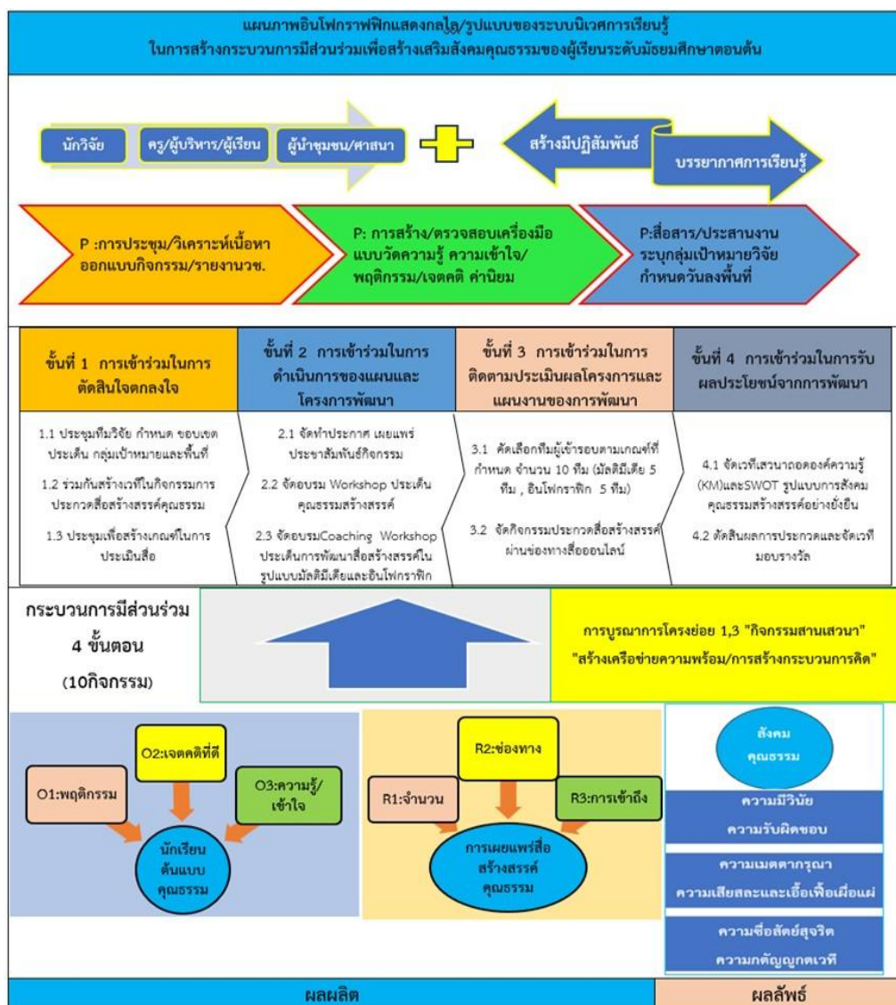
ภาพที่ 1 แสดงกลไก/รูปแบบของระบบนิเวศการเรียนรู้ในการสร้างการมีส่วนร่วมเพื่อสร้างเสริมสังคมคุณธรรมของผู้เรียนระดับมัธยมศึกษาต้น

ตัวชี้วัด มีเจตคติที่ดีต่อพฤติกรรมคุณธรรม และมีความรู้ ความเข้าใจเรื่องคุณธรรม สามารถสร้าง ชิ้นงานสื่อสร้างสรรค์คุณธรรมที่นำไปเผยแพร่ผ่านสื่อสังคมออนไลน์ มีการเข้าถึงที่รวดเร็ว ส่งผลให้ เกิดผลลัพธ์ส่วนหนึ่งในสังคม คือ สร้างระบบนิเวศสังคมคุณธรรม และทำการสร้างศูนย์สื่อสร้างเสริม สังคมคุณธรรม เป็นศูนย์ในรูปแบบออนไลน์ ที่ใช้ในการดำเนินกิจกรรมกระบวนการมีส่วนร่วมผ่าน การประกวดสื่อคุณธรรมสร้างสรรค์ จากโรงเรียนทั้ง 8 อำเภอที่เข้าร่วมโครงการ ภายในประกอบด้วย ขั้นตอนการดำเนินกิจกรรม หลักเกณฑ์ในการประเมินผลงาน สื่อที่กลุ่มเป้าหมายส่งเข้าประกวด รวมถึงกระบวนการมีส่วนร่วมในการเข้าชม กดไลค์ กดแชร์ เพื่อสะท้อนผลของกระบวนการมีส่วนร่วม ในวงกว้าง ดังภาพที่ 1