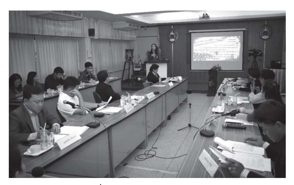
ภาพที่ 2 การจัดสนทนากลุ่ม (Focus Group)

และขอคำปรึกษาเกี่ยวกับข้อมูลแรงงาน ภายใน หน่วยงานสามารถให้บริการได้ครบวงจร และดำเนิน การภายในพื้นที่เดียว โดยภายในหน่วยงานมีการจัด หน่วยงานทั้งภาครัฐ เอกชน อยู่ในศูนย์ปฏิบัติงานที่ จัดตั้งขึ้นอาจประกอบไปด้วยตัวแทนจาก สำนักงาน ที่ดินจังหวัด สำนักงานตรวจคนเข้าเมือง สำนักงาน จัดหางาน อุตสาหกรรมจังหวัด กรมส่งเสริมการลงทุน สำนักงานพัฒนาธุรกิจการค้า บริษัทเอกชนต่าง ๆ ในจังหวัด เป็นต้น