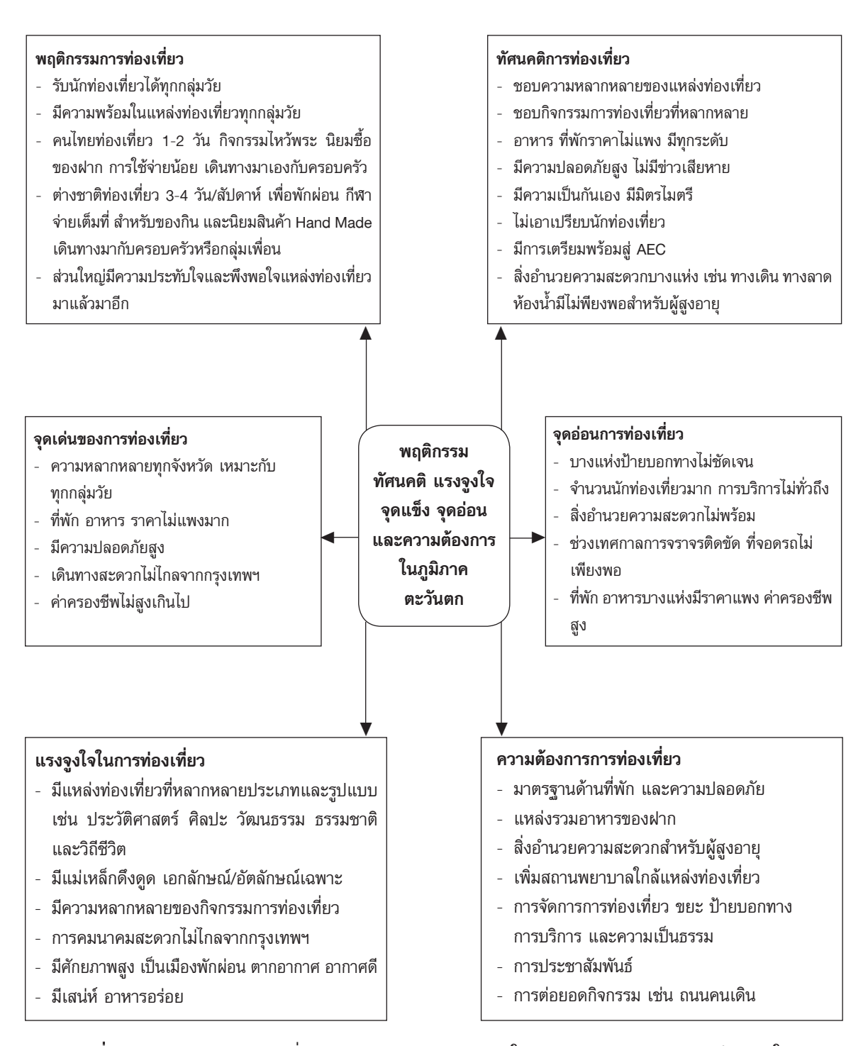
แผนภาพที่ 1 แสดงภาพรวมการท่องเที่ยว พฤติกรรม ทัศนคติ แรงจูงใจ จุดเด่น จุดอ่อน และความต้องการในภูมิภาค ตะวันตก 4 จังหวัด