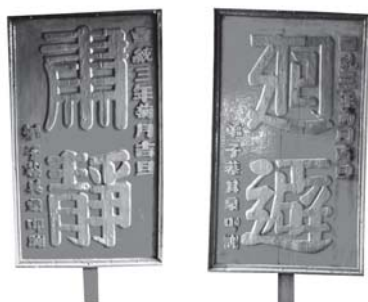
ภาพที่ 1 ป้ายที่ใช้ถือร่วมขบวนแห่พระกิวทองใต้เต่ เมื่อวันที่ 15 มกราคม 2555