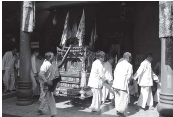
ภาพที่ 2 อัญเชิญ “ตัวเหลียน” เกี่ยวที่ประทับพระกิวหองไต่เต๋ออกแห่รอบเมืองตรัง เมื่อวันที่ 2 ตุลาคม 2554

ศักดิ์สิทธิ์ใดที่มีระดับสูงกว่าหรืออยู่ในระดับเดียวกัน ในขบวนนอกจากจะอัญเชิญพระกิวหองไต่เต๋ออกแห่รอบเมืองแล้ว ทางศาลเจ้าจะอัญเชิญพระโพธิสัตว์กวนอิมออกโปรดสาธุชนด้วยเช่นกัน โดยจะอัญเชิญเทวรูปโพธิสัตว์กวนอิมประทับในตัวเหลียน ซึ่งจะเป็นลักษณะเปิด สามารถมองเห็นเทวรูปในตัวเหลียนได้ ตำแหน่งขบวนตัวเหลียนของโพธิสัตว์กวนอิมจะอยู่หลังตัวเหลียนของพระกิวหองไต่เต๋