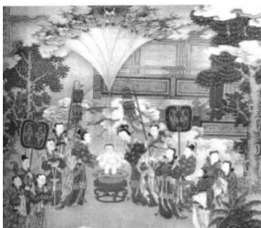
ภาพที่ 5 พญามังกร 9 ตัวพ่นน้ำถวายให้กับสิทธัตถะกุมารในงานจิตรกรรมจีน ที่มา: จิตรกร ก่อฉันทเกียรติ และอลังการจีนศิลป์ (2545)

จิตรกร ก่อฉันทเกียรติ (2545) กล่าวว่าประเทศจีนเมื่อรับเอาพระพุทธศาสนาเถรวาทจากทางเหนือของอินเดียมา มังกรที่ชาวจีนนับถือมาแต่เดิมก็ไม่ได้ถูกลดบทบาทความสำคัญทางด้านคติและความเชื่อลงแต่อย่างใด แต่กลับเข้าไปมีบทบาทในเรื่องราวทางพระพุทธศาสนา เช่น ภาพจิตรกรรมพุทธประวัติตอนที่พระนางสิริมหามายาทรงสร่งน้ำให้กับสิทธัตถะกุมาร โดยมีพญามังกร 9 ตัวพ่นน้ำถวาย(ดังภาพที่ 5) หรือเรื่องราวของลูกสาวของพญามังกรชื่อเล่งนึ่งที่เลื่อมใสในพระโพธิสัตว์อวโลกิเตศวรมากจนถึงกับปวารณาตนเป็นบริวารรับใช้ฝ่ายหญิง (ดังภาพที่ 6) เป็นต้น