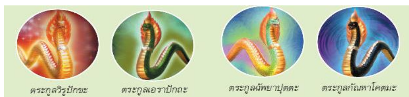
ภาพที่ 1 พญานาค 4 ตระกูล

การกำเนิดที่ต้องอาศัยกรรมมารดา ส่วนการกำเนิดแบบสังเสทชะและโอปปาติกะเป็นการกำเนิดแบบไม่ต้องอาศัยกรรมมารดา และตามพระสูตรหิตสูตร มีการแบ่งพญานาคออกเป็น 4 ตระกูล คือ 1) ตระกูลวิรูปักษะ เป็นพญานาคที่มีผิวกายเป็นสีทองคำ 2) ตระกูลเอราปิกถะ เป็นพญานาคที่มีผิวกายเป็นสีเขียว 3) ตระกูลฉัพพาปุตตะ เป็นพญานาคที่มีผิวกายเป็นสีรุ้ง 4) ตระกูลกัณหาโคตรมะ เป็นพญานาคที่มีผิวกายเป็นสีดำ (ดังภาพที่ 1) โดยการกำเนิดของพญานาคทั้ง 4 ตระกูล สามารถกำเนิดได้จากทั้ง 4 ประเภท