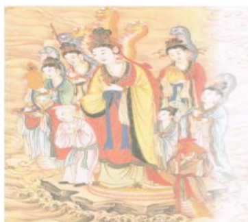
ภาพที่ 6 เล่งนึ่งลูกสาวของพญามังกรปวารณาตนเป็นบริวารรับใช้ของพระโพธิสัตว์อวโลกิเตศวร ที่มา: จิตรกร ก่อฉันทเกียรติ (2545)