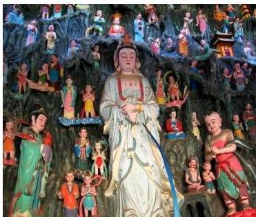
ภาพที่ 4 อัครสาวกเบ็องขวาและอัครสาวกเบ็องซ้าย

จิตรกร ก่อฉันทเกียรติ (2545) กล่าวว่าประเทศจีนเมื่อรับเอาพระพุทธศาสนาเถรวาทจากทางเหนือของอินเดียมา มังกรที่ชาวจีนนับถือมาแต่เดิมก็ไม่ได้ถูกลดบทบาทความสำคัญทางด้านคติและความเชื่อลงแต่อย่างใด แต่กลับเข้าไปมีบทบาทในเรื่องราวทางพระพุทธศาสนา เช่น ภาพจิตรกรรมพุทธประวัติตอนที่พระนางสิริมหามายาทรงสร่งน้ำให้กับสิทธัตถะกุมาร โดยมีพญามังกร 9 ตัวพ่นน้ำถวาย(ดังภาพที่ 5) หรือเรื่องราวของลูกสาวของพญามังกรชื่อเล่งนึ่งที่เลื่อมใสในพระโพธิสัตว์อวโลกิเตศวรมากจนถึงกับปวารณาตนเป็นบริวารรับใช้ฝ่ายหญิง (ดังภาพที่ 6) เป็นต้น