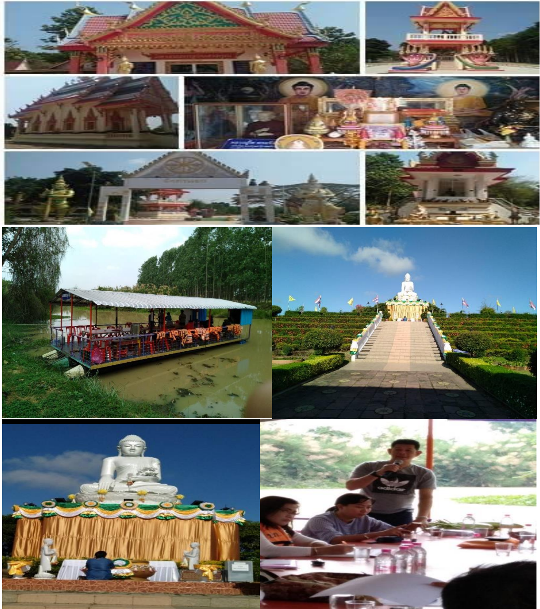
ภาพที่1 พาหน่าเที่ยว/วัดพระหยกขาว/วัดท่าแยก

ผลการวิเคราะห์ข้อมูลที่ได้จากการสัมภาษณ์คณะกรรมการของชุมชน เรื่อง การมีส่วนร่วมของประชาชนในการจัดการท่องเที่ยวเชิงวัฒนธรรมตำบลหนองบอน อำเภอเมือง จังหวัดสระแก้ว เพื่อให้เกิดการพัฒนาอย่างยั่งยืนดังนี้