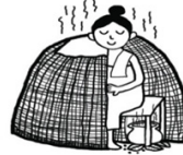
การอบสมุนไพร

ภาพที่ 1 การเข้ากำหรือเข้ากรรมหลังจากสตรีคลอดบุตรด้วยนอนอย่างไฟ (อยู่ไฟ) และการอบสมุนไพร