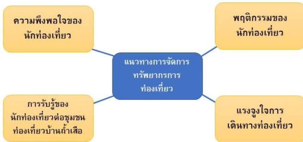
ภาพที่ 1 กรอบแนวคิดในการศึกษา